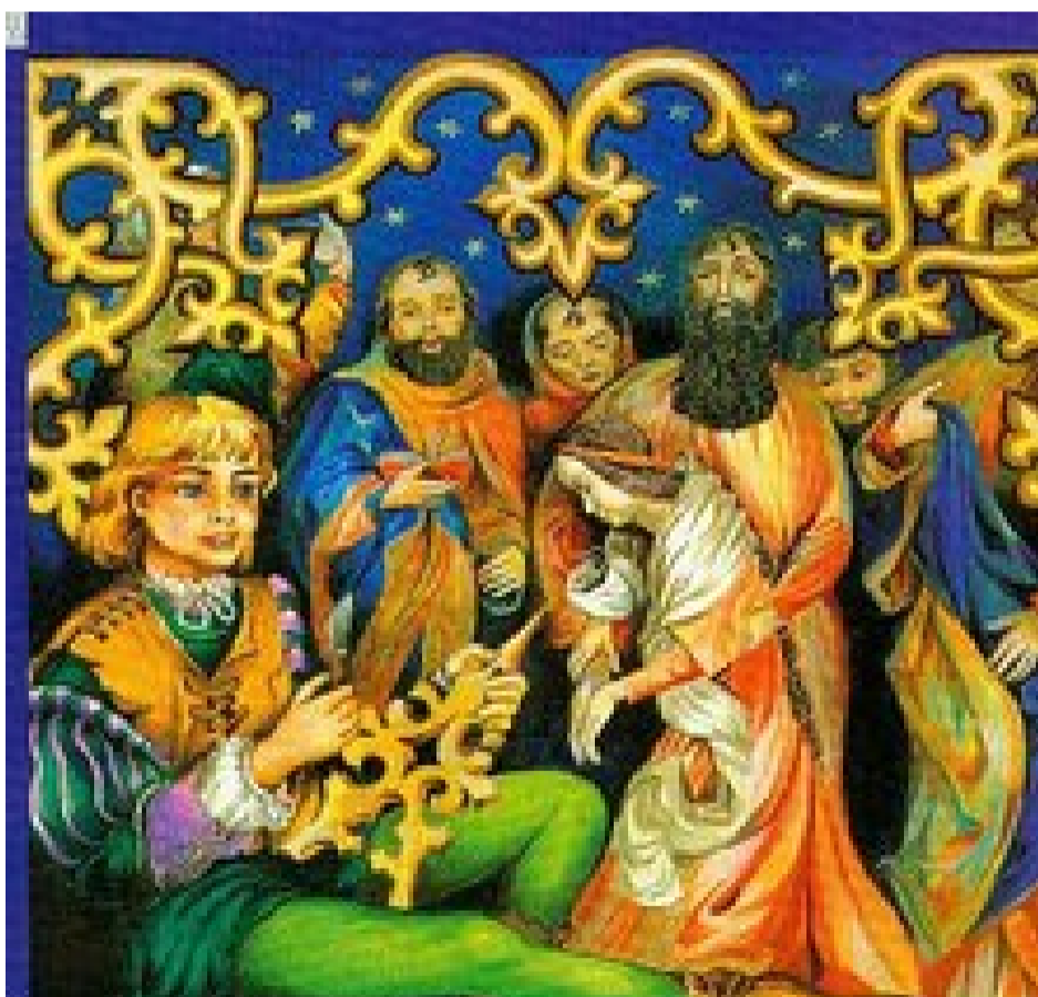
Historia żółtej cizemki

Historię Żółtej cizemki napisała Antonina Domańska. Kim jest główny bohater? To Wawrzus - mieszka na wsi mały chłopiec miał ogromny talent - potrafił rzeźbić w drewnie przepiękne figurki. A jego bliscy nie doceniali jego zdolności chociaż powinni być z niego dumni jako rodzina. Po kolejnej kłótni chłopiec uciekł z domu i na skutek kilku szczęśliwych zbiegów okoliczności na całe szczęście trafił do Krakowa, pod skrzydła wielkiego mistrza rzeźbiarskiego Wita Stwosza. Jak dalej potoczą się jego losy? Czy będzie rozwijał swój talent? Przeczytajcie o tym w pięknej powieści Antoniny Domańskiej, która w ciekawy sposób przedstawia w swojej książce rzeczywistość średniowiecznego Krakowa. Polecamy przeczytanie tej książki i zwiedzenie pięknego Krakowa.