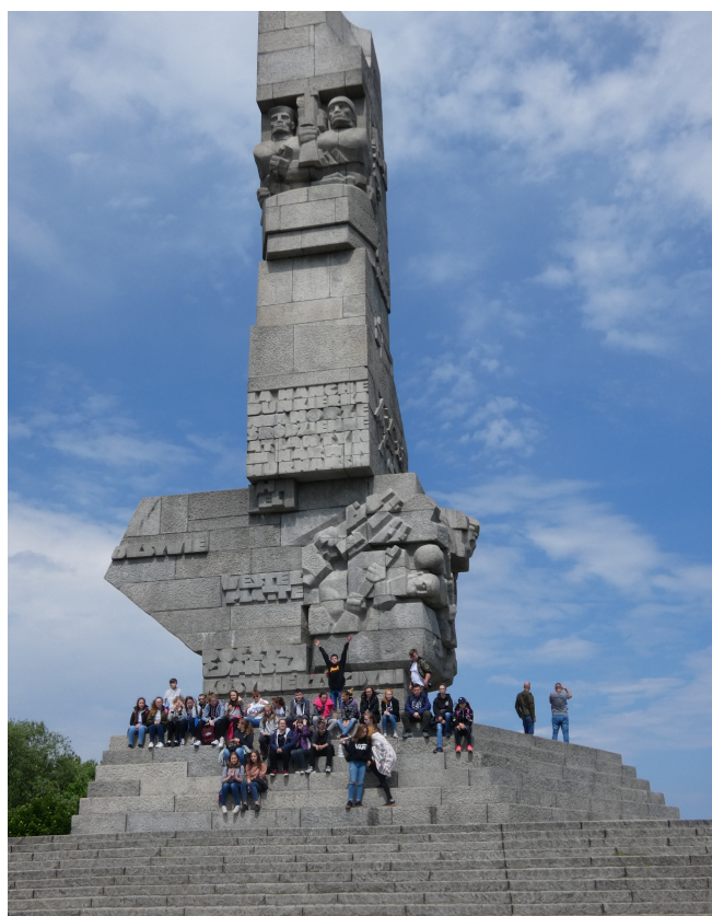
Wycieczka Klas VII