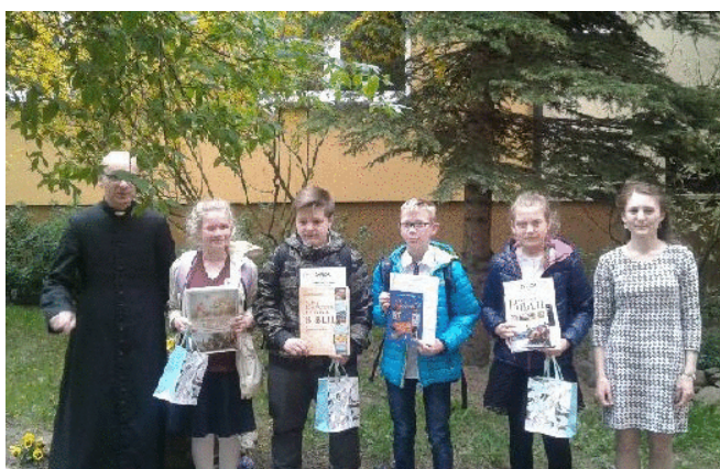
II Wielkopolski Konkurs Biblijny