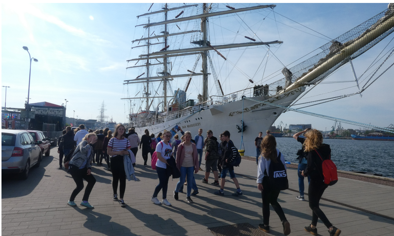
Wycieczka klas VII