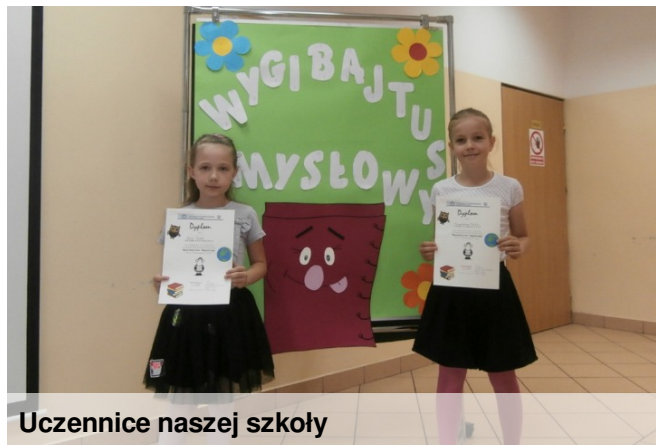
Uczennice naszej szkoły