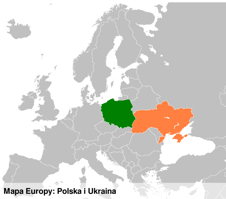
Mapa Europy: Polska i Ukraina