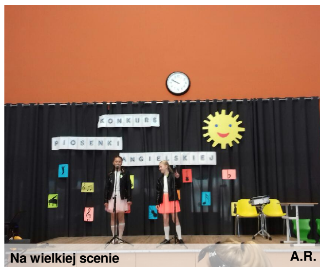
Na wielkiej scenie