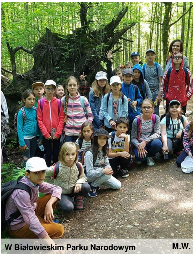
W Białowieskim Parku Narodowym