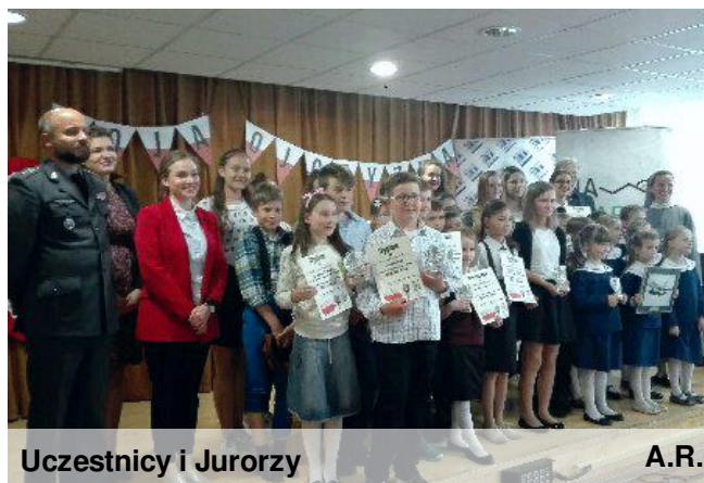
Uczestnicy i Jurorzy