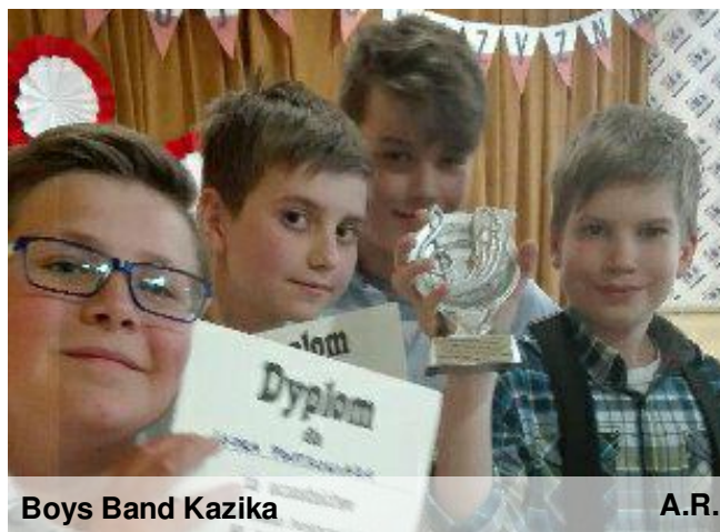
Boys Band Kazika