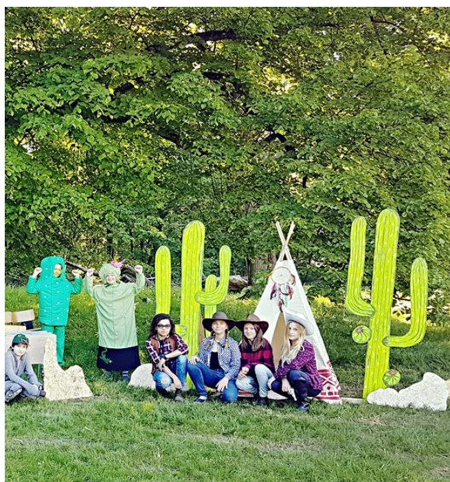
Klasa 6 podczas Dnia Patrona