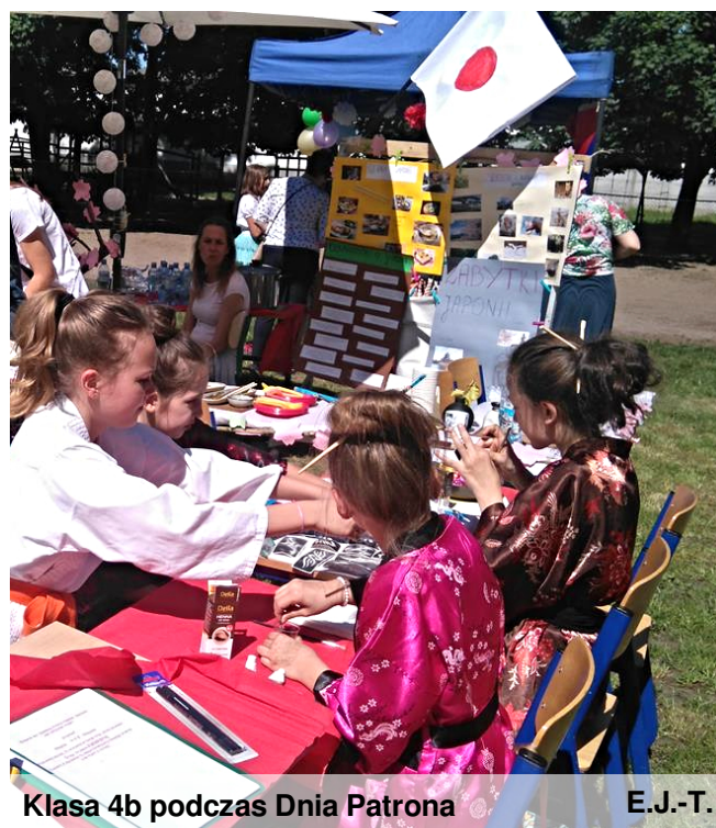
Klasa 4b podczas Dnia Patrona