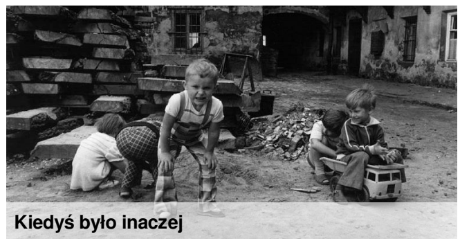
Kiedyś było inaczej