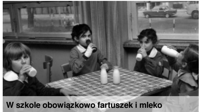
W szkole obowiązkowo fartuszek i mleko