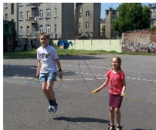
Dzieciństwo - zabawa na skakance