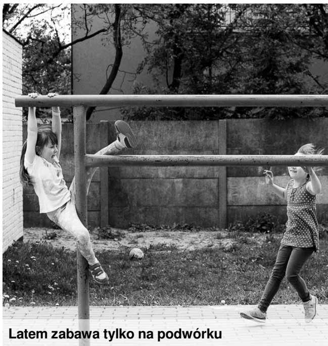
Latem zabawa tylko na podwórku