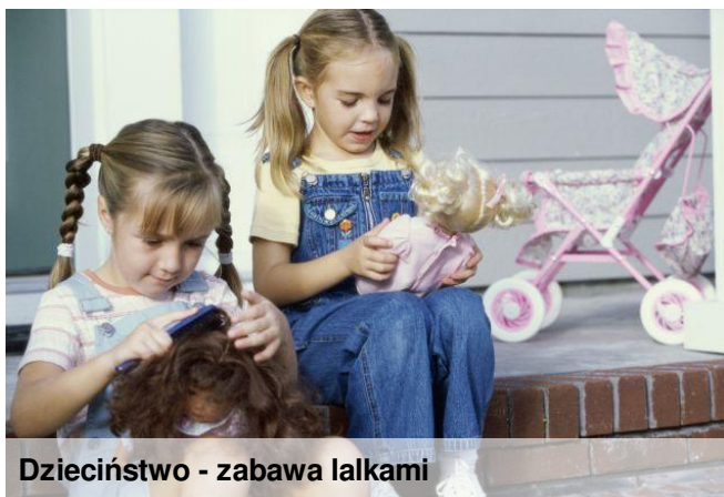
Dzieciństwo - zabawa lalkami

Babcia: Bardzo lubiłam skakać na skakance i grać w gumę. Bawiliśmy się też w berka czy chowanego. Najbardziej lubiłam jednak grać w „pobite gary” – ta gra jest bardzo podobna do chowanego. Wybierało się osobę, która będzie szukać. Na podwórku kładło się piłkę i jedna osoba ją wykopywała, w tym czasie trzeba było się schować. W trakcie gry można było wiele razy wykopywać piłkę, pod warunkiem, że dobiegło się do niej przed osobą szukającą – to pozwalało osobom, które były już znalezione schować się jeszcze raz.