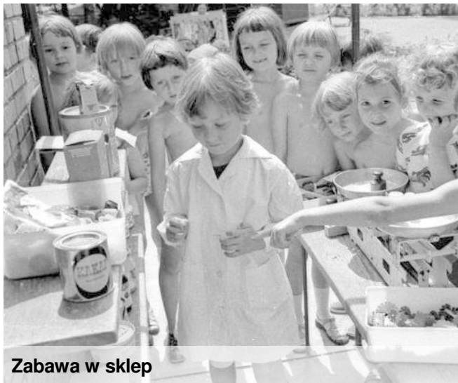
Zabawa w sklep

Babcia: Gdy byłam w twoim wieku, to bawiłam się w sklep z moją najlepszą koleżanką Jadzią, skakałam na skakance, grałam w klasy i w chłopa, biegałam z koleżankami i kolegami po polach, zimą bawiłam się w pocztę (pod stołem), często też babcia, zwłaszcza zimą, opowiadała nam różne ciekawe historie.