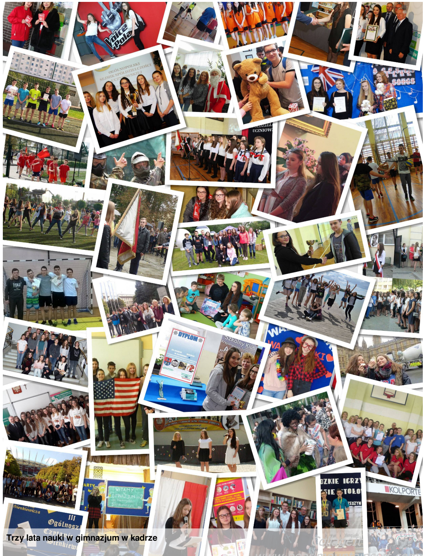
Trzy lata nauki w gimnazjum w kadrze