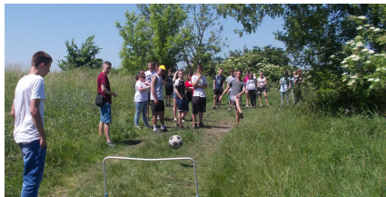
Na jednym z punktów...