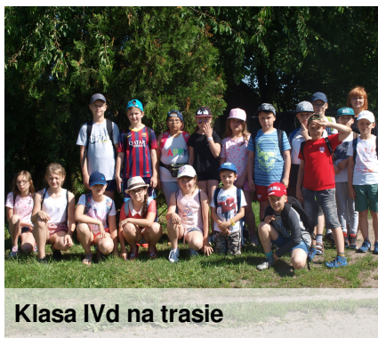
Klasa IVd na trasie