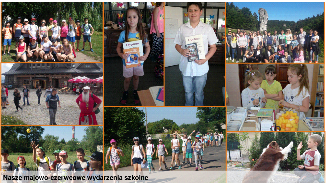
Nasze majowo-czerwcowe wydarzenia szkolne