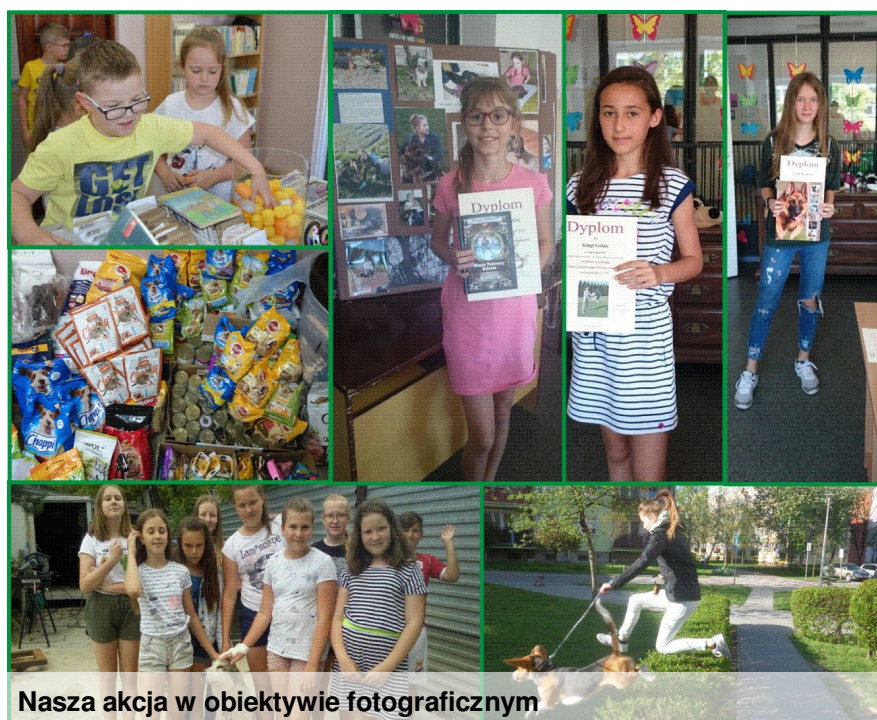
Nasza akcja w obiektywie fotograficznym