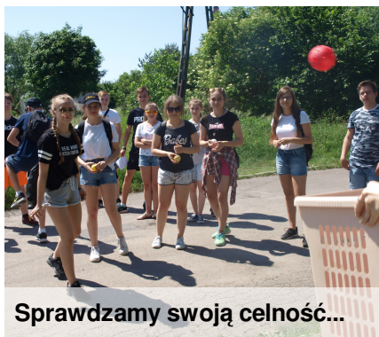
Sprawdzamy swoją celność...