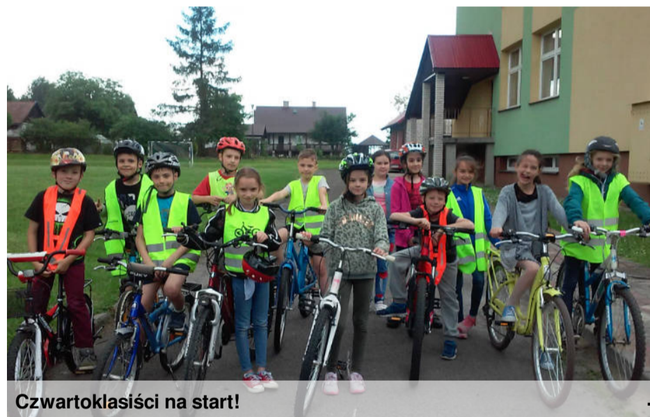
Czwartoklasiści na start!