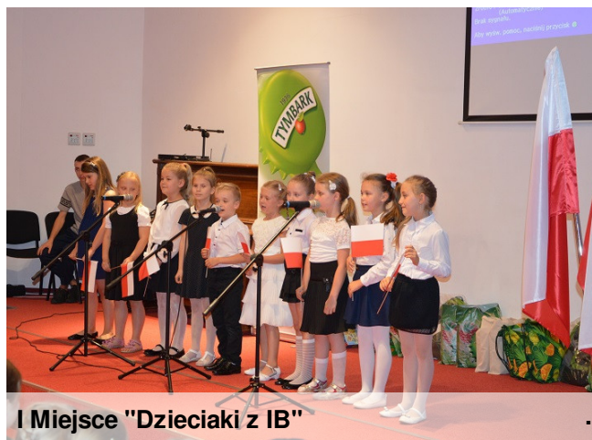
I Miejsce "Dzieciaki z IB"