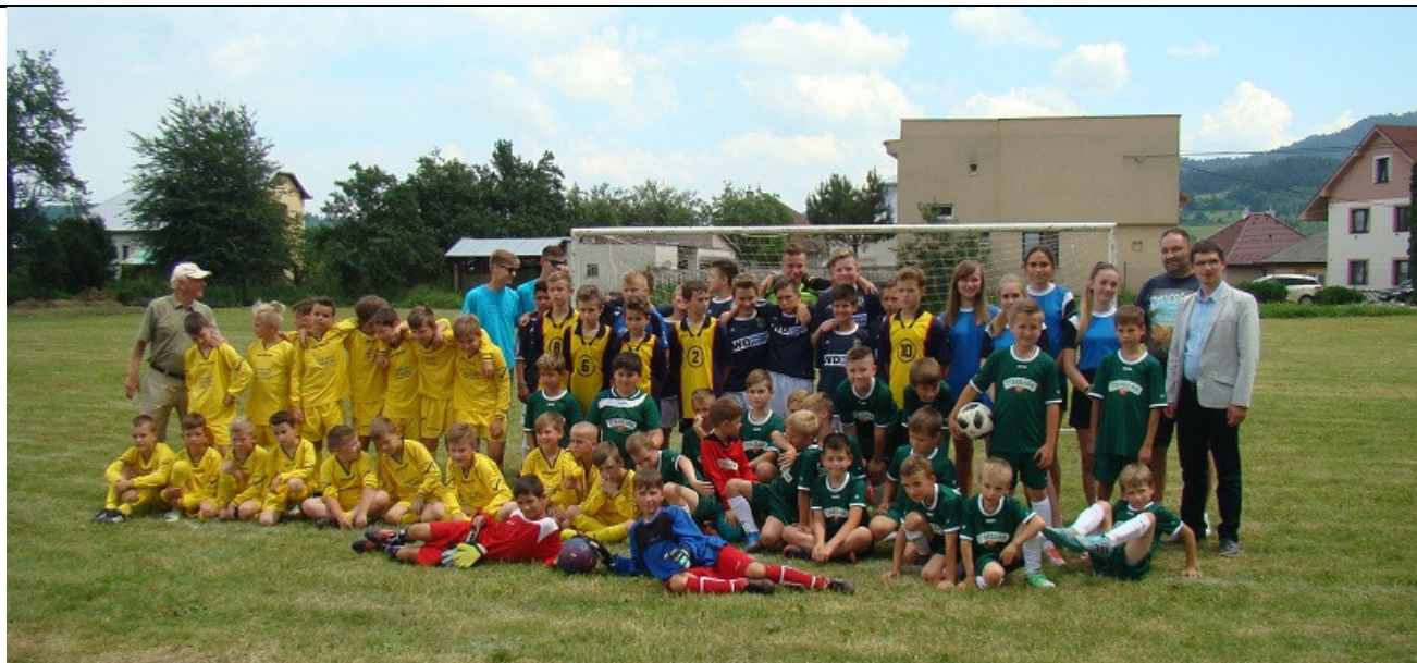
Turniej w Słowacji

8 maja 2018 roku, w dziesiątym roku współpracy pomiędzy szkołami Gminy Tymbark i szkołami miasta Spišské Vlachy, odbyło się kolejne sportowe spotkanie drużyn piłkarskich.