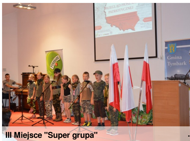
III Miejsce "Super grupa"