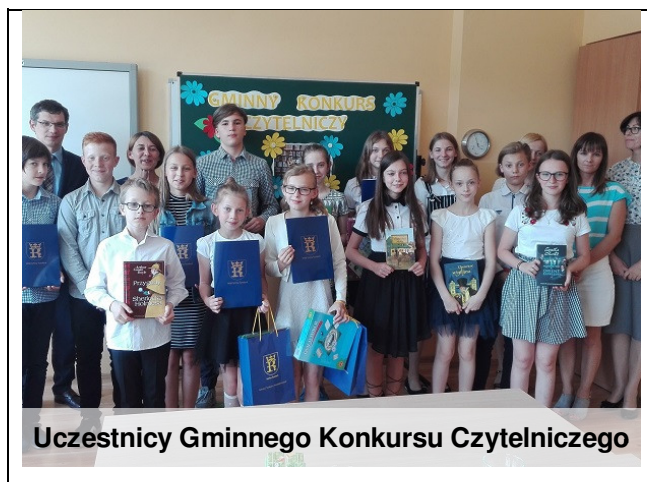
Uczestnicy Gminnego Konkursu Czytelniczego

29 maja 2018 r. w Szkole Podstawowej im. Tadeusza Kościuszki w Zawadce odbył się Gminny Konkurs Czytelniczy, w którym uczestniczyło 7 uczniów klas IV-V oraz 8 uczniów klas: VI-VII ze szkół podstawowych z terenu Gminy Tymbark. Celem konkursu było przede wszystkim rozbudzenie pasji czytelniczych oraz popularyzacja wartościowej literatury dla dzieci i młodzieży. Konkurs został przeprowadzony w formie testu z podziałem na kategorie poszczególnych klas IV-V i VI-VII. Uczestnicy mieli za zadanie wykazać się znajomością treści powieści Roalda Dahl „Matylda” (uczniowie klas: IV-V) lub powieści Agaty Christie „Dwanaście prac Herkulesa”(uczniowie klas: VI-VII).