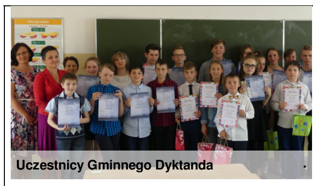
Uczestnicy Gminnego Dyktanda