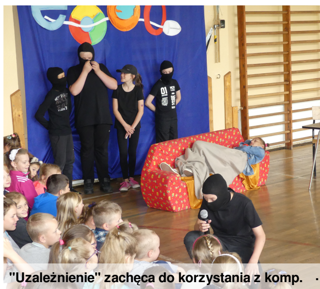
"Uzależnienie" zachęca do korzystania z komp.