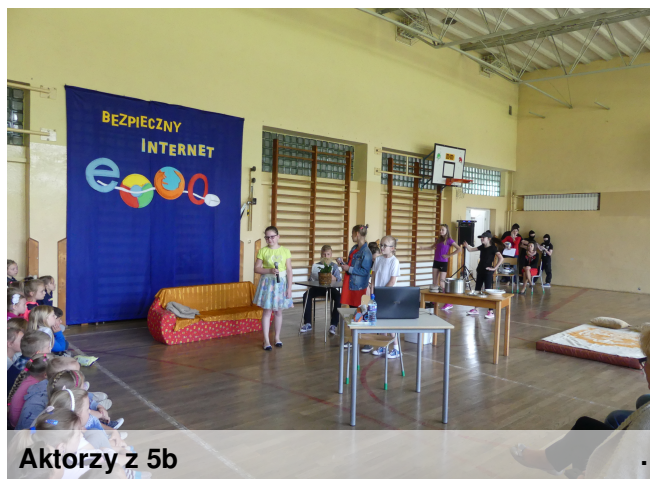
Aktorzy z 5b