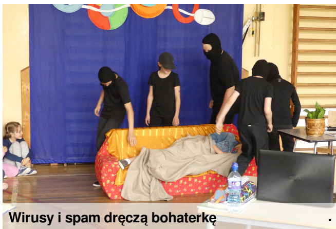
Wirusy i spam dręczą bohaterkę