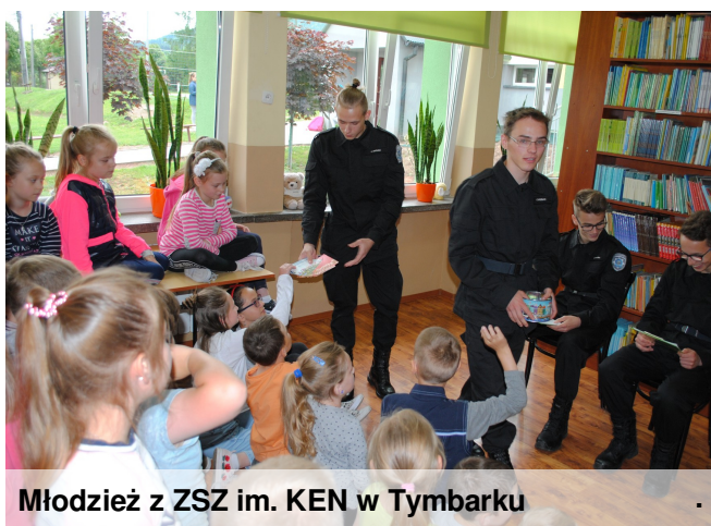
Młodzież z ZSZ im. KEN w Tymbarku

Tradycyjnie maj to miesiąc poświęcony książce i czytelnictwu. Szczególnie w dniach 8-15 maja 2018r. obchodziliśmy Tydzień Bibliotek - program promocji czytelnictwa i bibliotek. Miał on na celu podkreślanie roli czytania i bibliotek w poprawie jakości życia, edukacji oraz zainteresowania książką. Tegoroczna edycja Tygodnia Bibliotek 2018 odbywała się pod hasłem: „(Do)Wolność Czytania”. Z tej okazji zostały podjęte działania mające na celu propagowanie czytelnictwa.