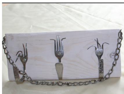
oryginalny wieszak :D