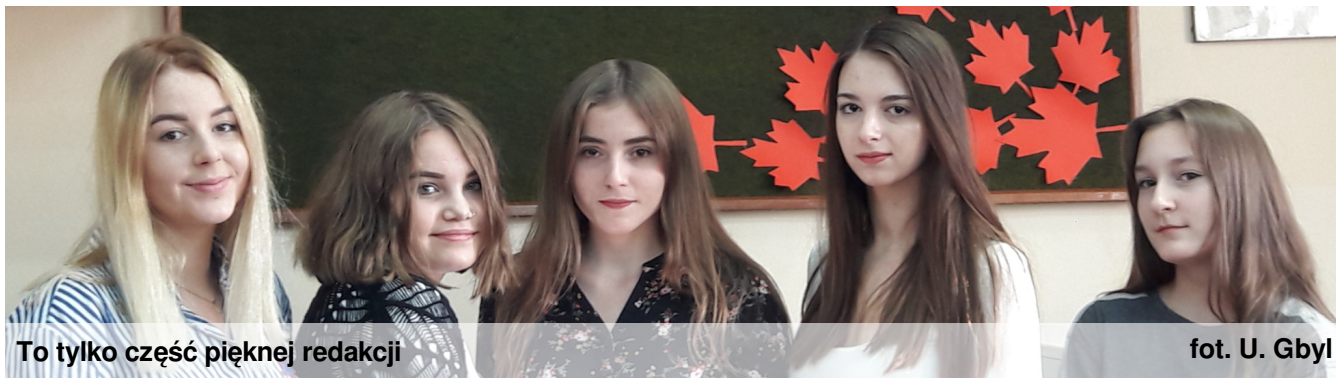
To tylko część pięknej redakcji