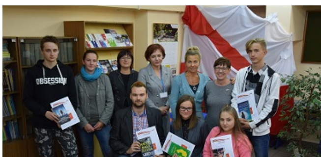
Wspólna fotka z najlepszymi