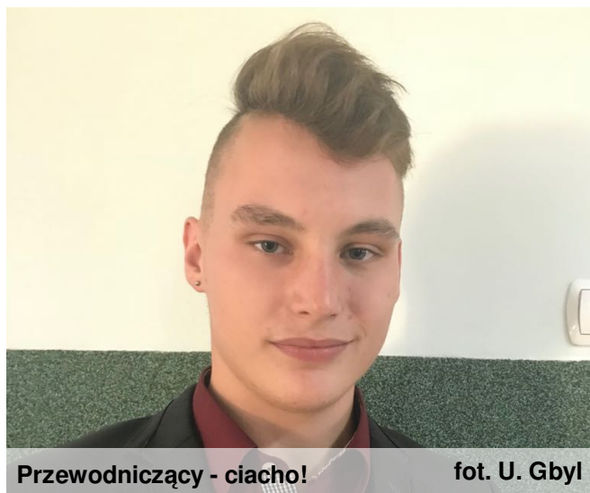
Przewodniczący - ciacho!