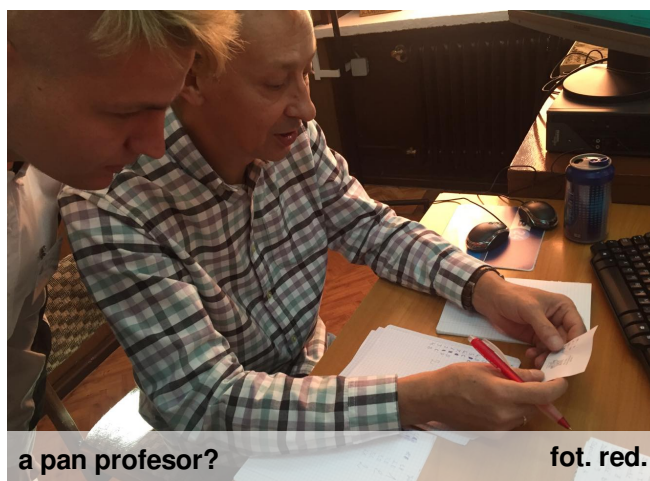
a pan profesor?