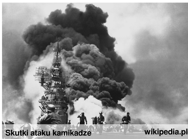
Skutki ataku kamikadze

W dniach 19–20 czerwca 1944 roku doszło do bitwy między flotami USA i Japonii, w której państwo kwitnącej wiśni poniosło ogromne straty. Wtedy to też w głowie japońskiego dowódcy narodził się pomysł, aby wypełniać samoloty materiałami wybuchowymi i wysyłać na front, jednak ten pomysł musiał jeszcze trochę poczekać. Sama idea ataku samobójczego w celu zniszczenia wrogich jednostek nie była nowa. Przykłady poświęcania się żołnierzy w atakach pozbawionych szansy na przeżycie są znane od początku historii wojen. Postęp techniczny w XX wieku spowodował powstanie nowych środków bojowych, za pomocą których można było dokonywać takich ataków, szczególnie za pomocą samolotu, który gwarantował łatwość i szybkość dotarcia do wrogich celów. Pierwszą jednostką kamikadze utworzono w październiku 1944 a jej popularność była... ogromna. Wielu młodych mężczyzn zawsze znajdowało się w gotowości, aby oddać swe życie za ojczyznę.