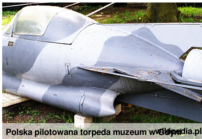
Polska pilotowana torpeda muzeum wikipedia.pl