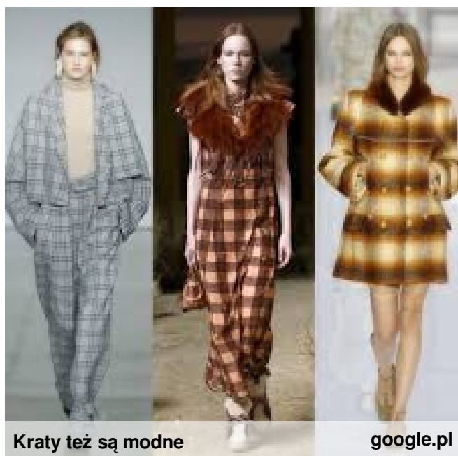
Kraty też są modne