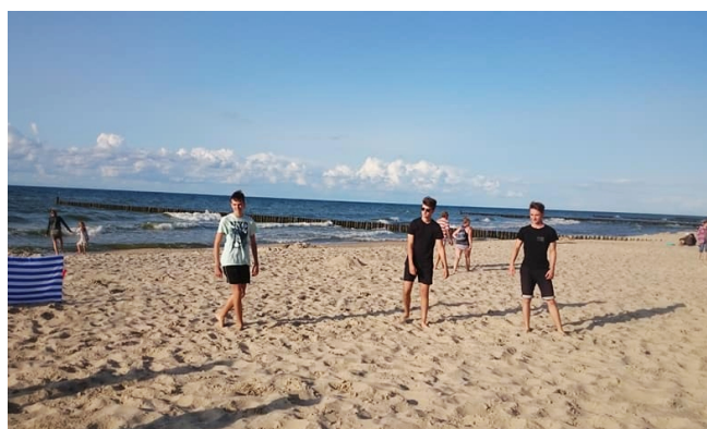
Piękna polska plaża