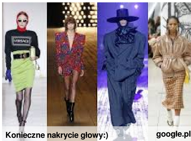
Konieczne nakrycie głowy:)