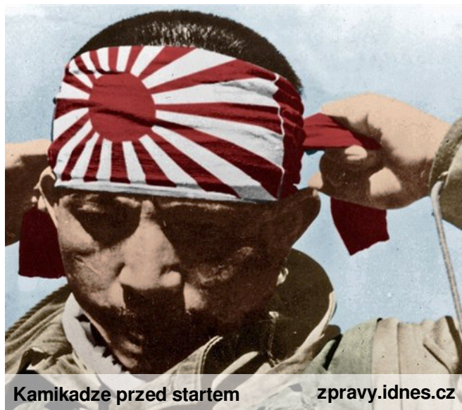
Kamikadze przed startem