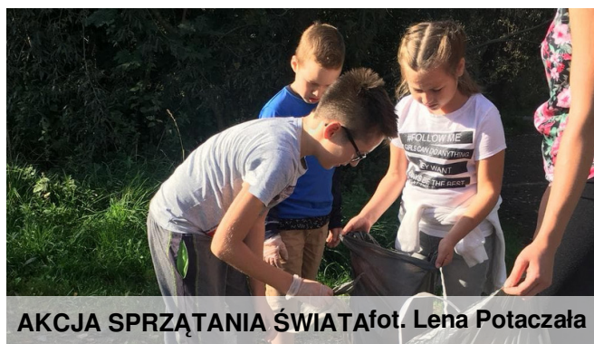
AKCJA SPRZĄTANIA ŚWIATA