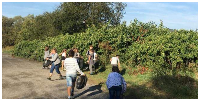
AKCJA SPRZĄTANIA ŚWIATA