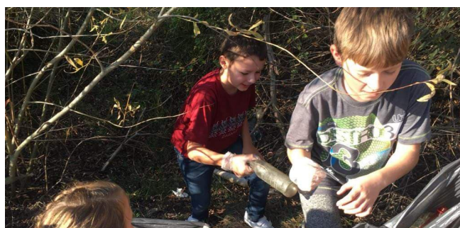
AKCJA SPRZĄTANIA ŚWIATA