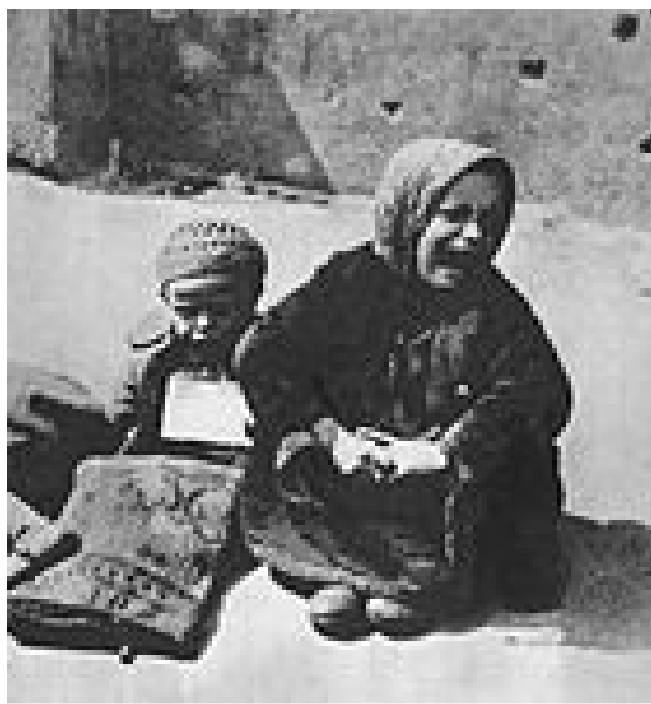
Dzieci z Getta