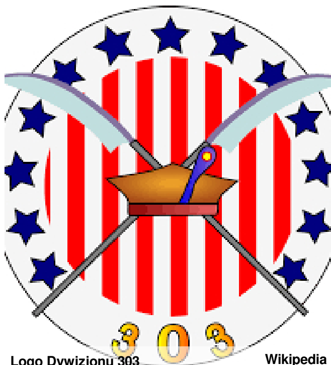
Logo Dywizjonu 303