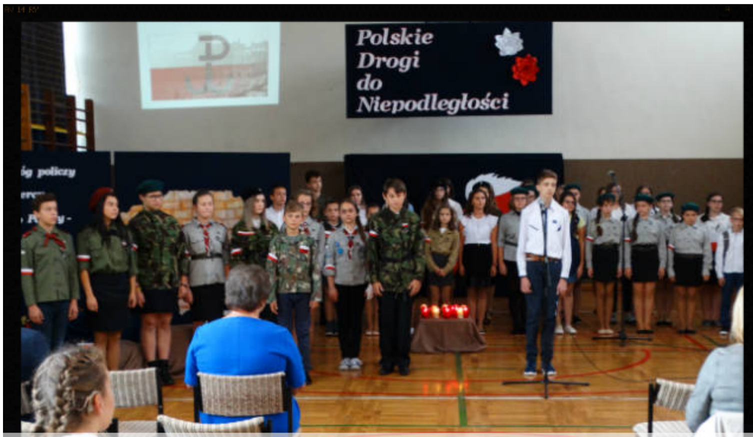
W czasie akademii