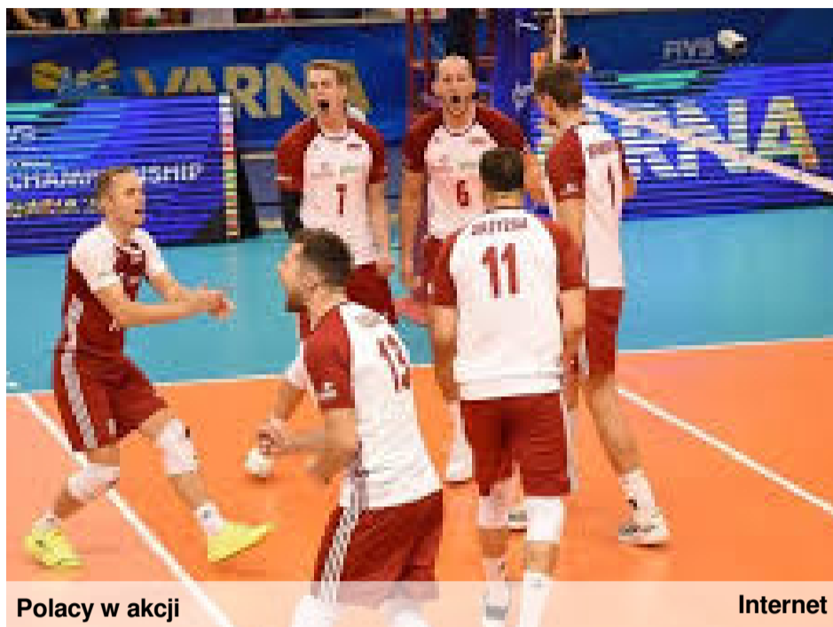
Polacy w akcji