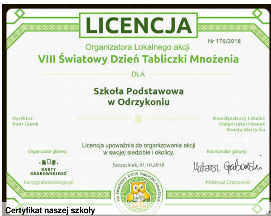
Certyfikat naszej szkoły

W tym roku do akcji zgłosiło się 4579 szkół z 36 krajów. Czwarty WMTday w naszej szkole za nami. Tym razem dokonaliśmy podsumowania znajomości tabliczki mnożenia. I oto: