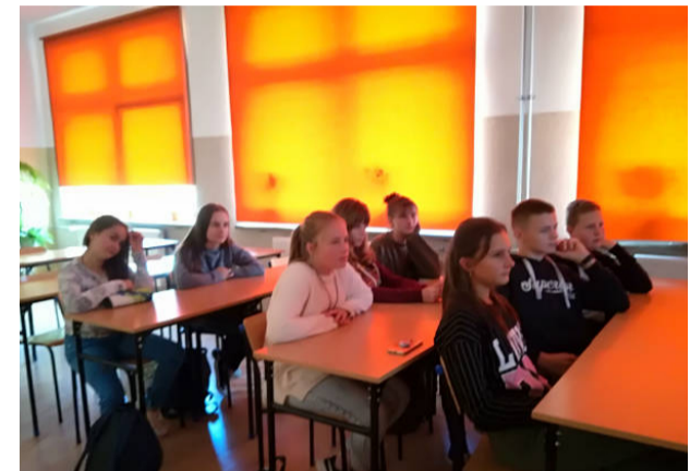
W czasie lekcji