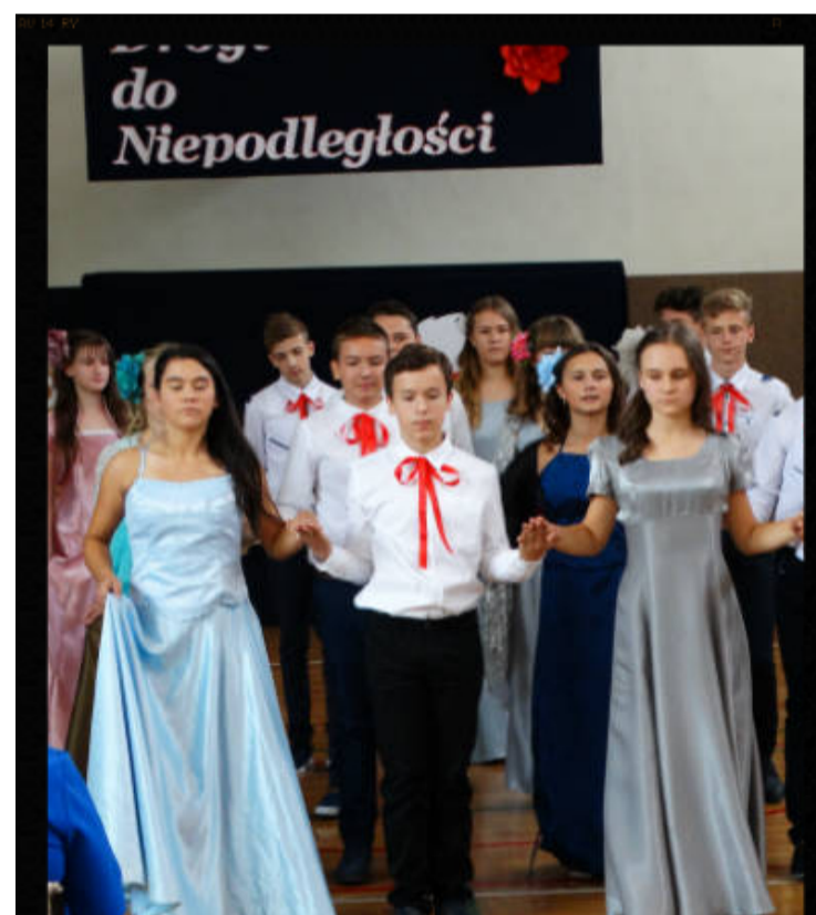
W trakcie poloneza