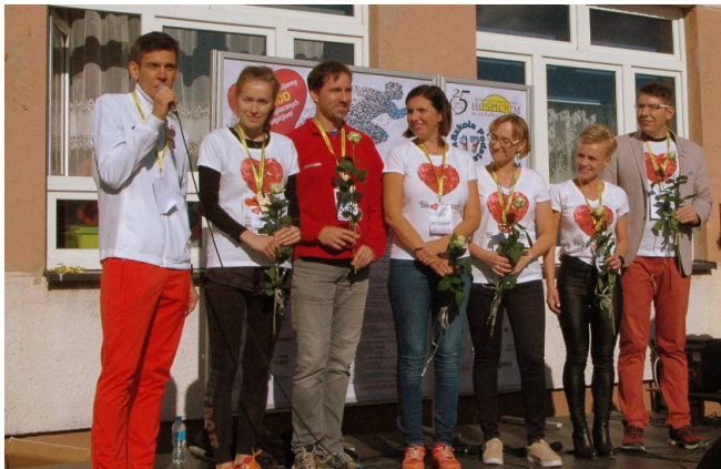
Organizatorzy biegu wraz z ambasadorem