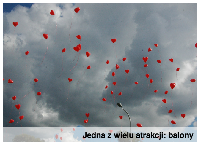
Jedna z wielu atrakcji: balony