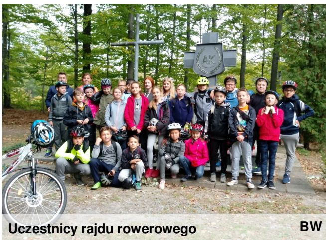
Uczestnicy rajdu rowerowego