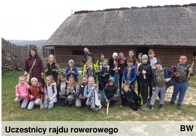
Uczestnicy rajdu rowerowego