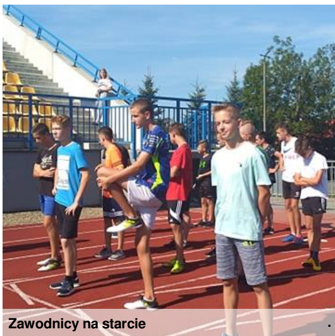
Zawodnicy na starcie