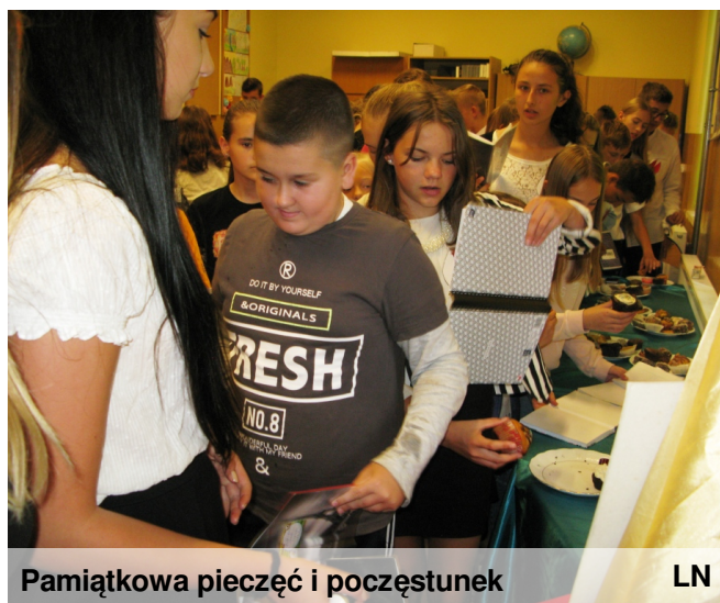
Pamiątkowa pieczęć i poczęstunek