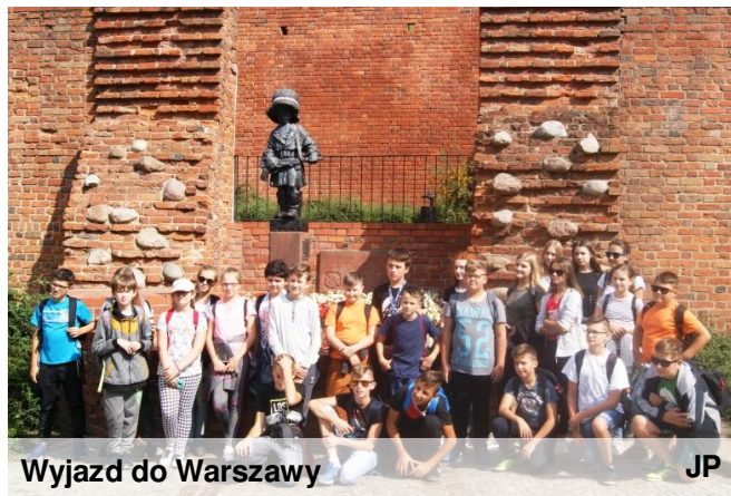
Wyjazd do Warszawy