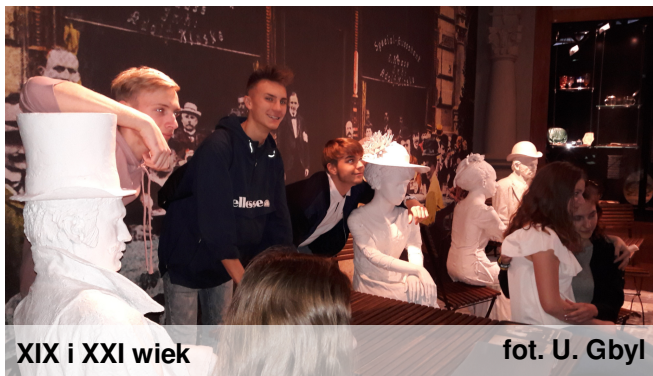
XIX i XXI wiek