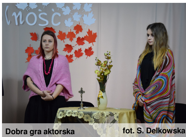
Dobra gra aktorska