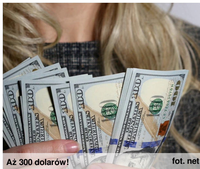
Aż 300 dolarów!

- Świetnie. To lepiej się połóż, bo za kilka godzin idziemy.