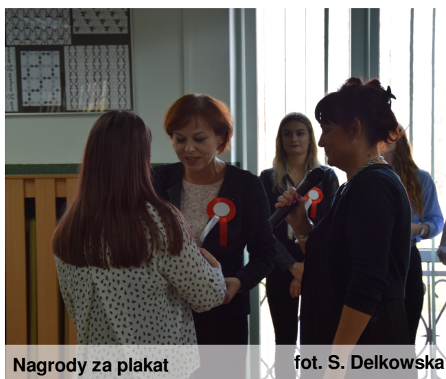
Nagrody za plakat