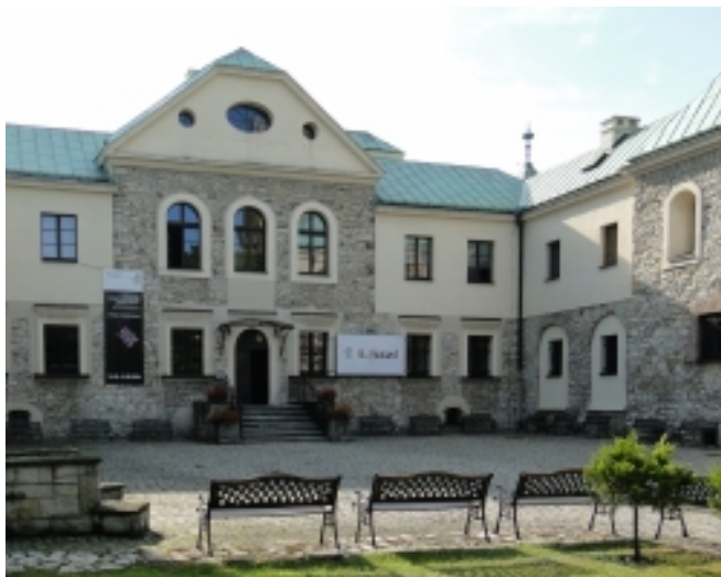
Sosnowieckie Centrum Sztuki