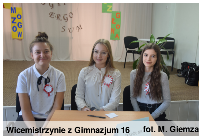
Wicemistrzynie z Gimnazjum 16