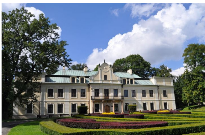
Muzeum Zagłębia w Będzinie