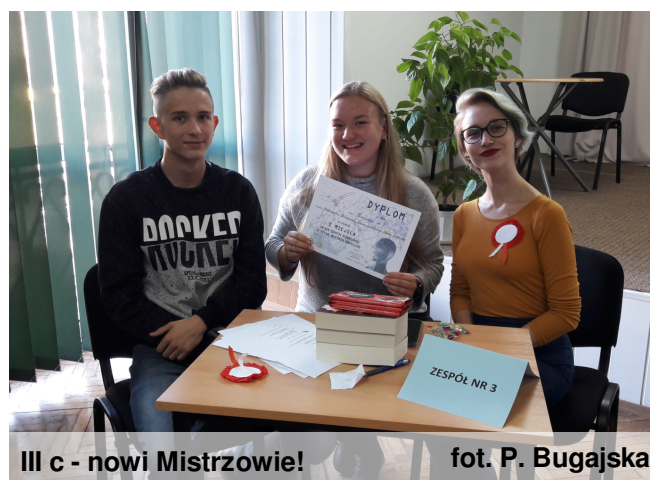
III c - nowi Mistrzowie!