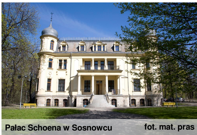
Pałac Schoena w Sosnowcu