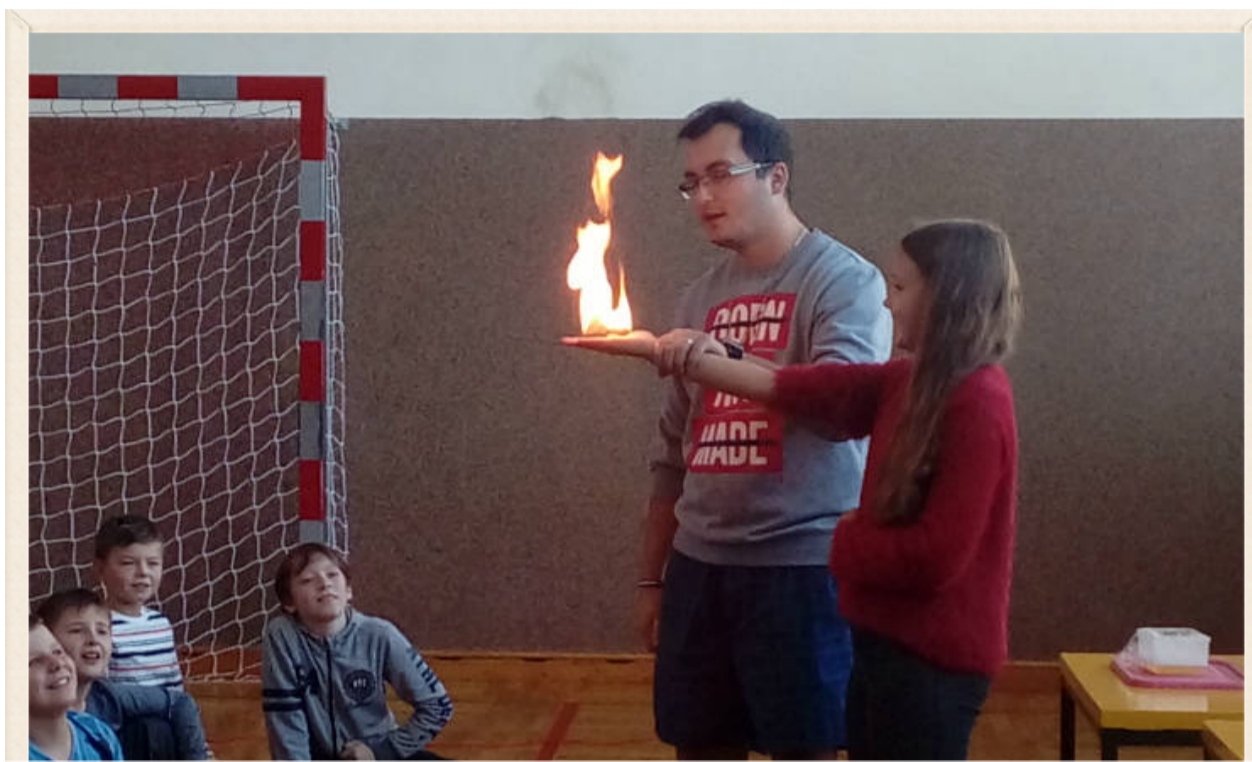
Ogień na dłoni! Czemu nie?!