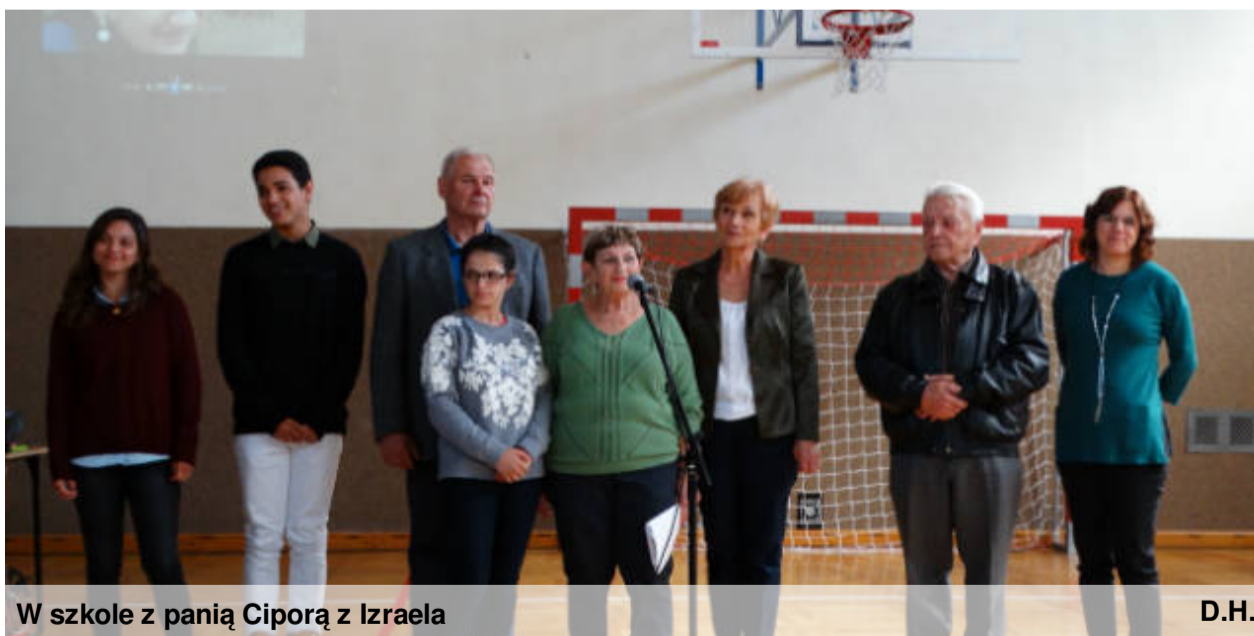
W szkole z panią Ciporą z Izraela