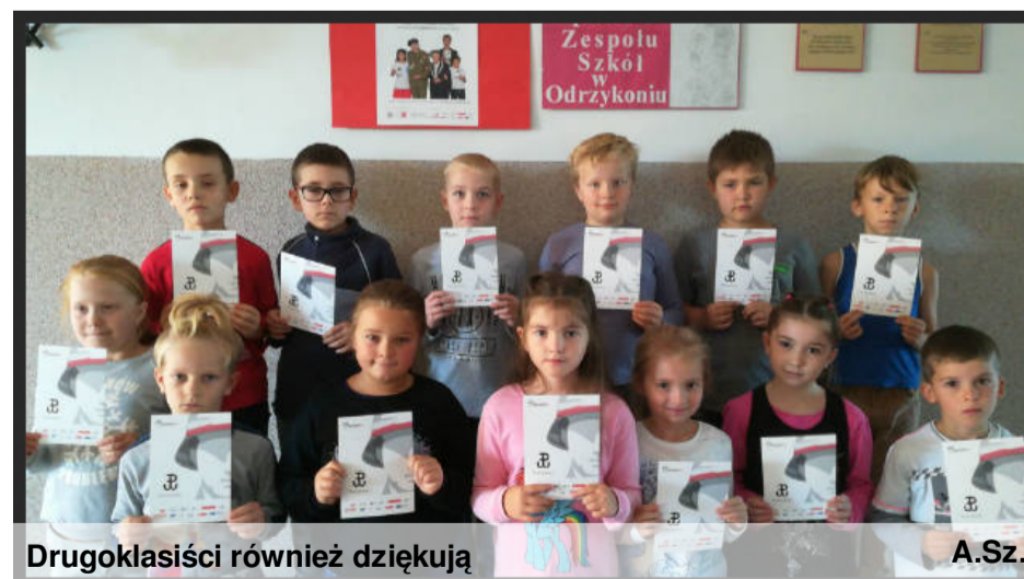
Drugoklasiści również dziękują