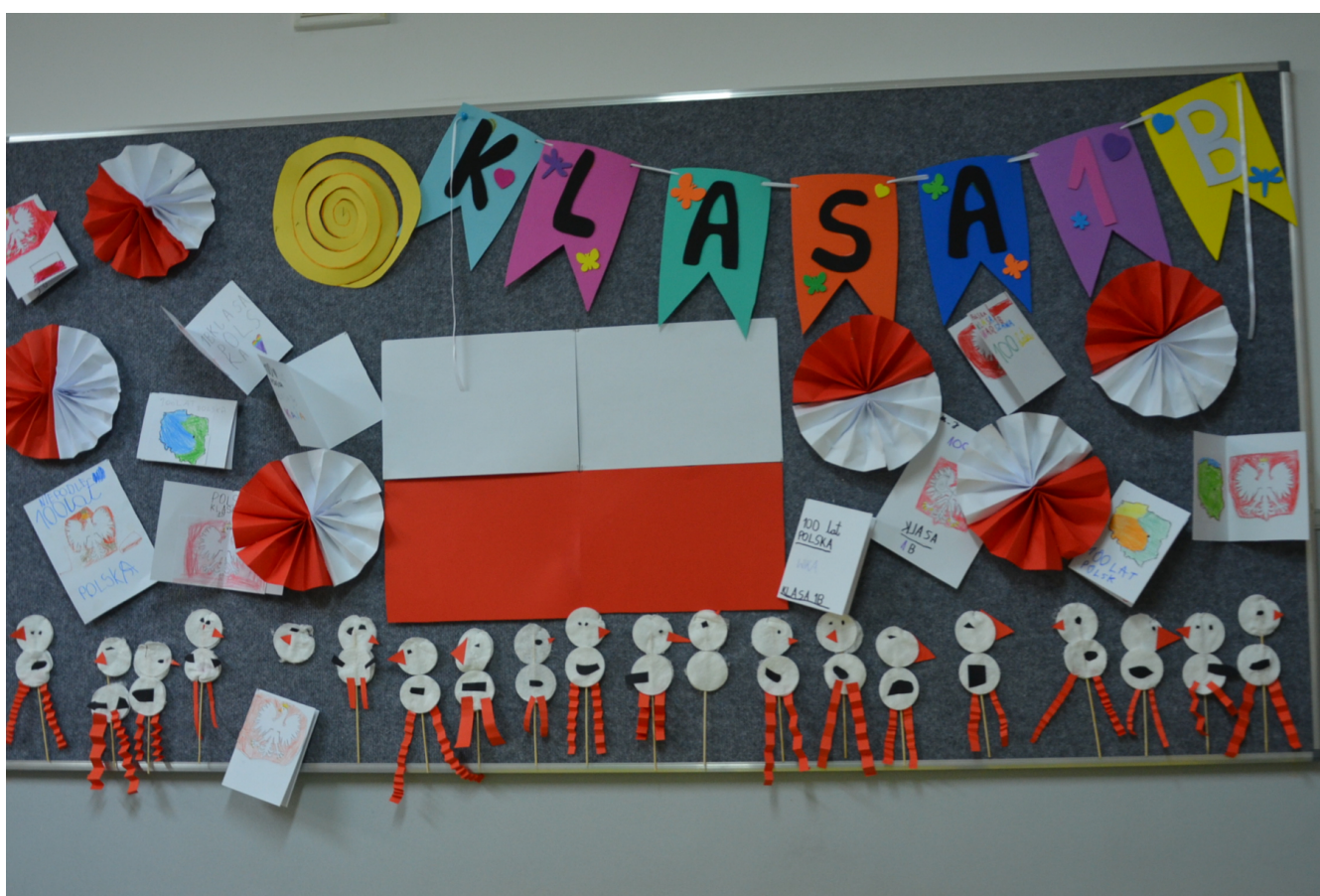
Gazetka okolicznościowa klasy 1b

Stulecie odzyskania przez Polskę Niepodległości widać było w naszej szkole na każdym kroku. Na korytarzach pojawiły się gazetki okolicznościowe, było wspólne śpiewanie hymnu oraz uroczysty koncert.