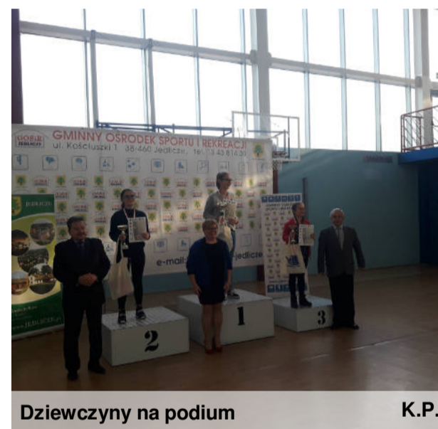
Dziewczyny na podium