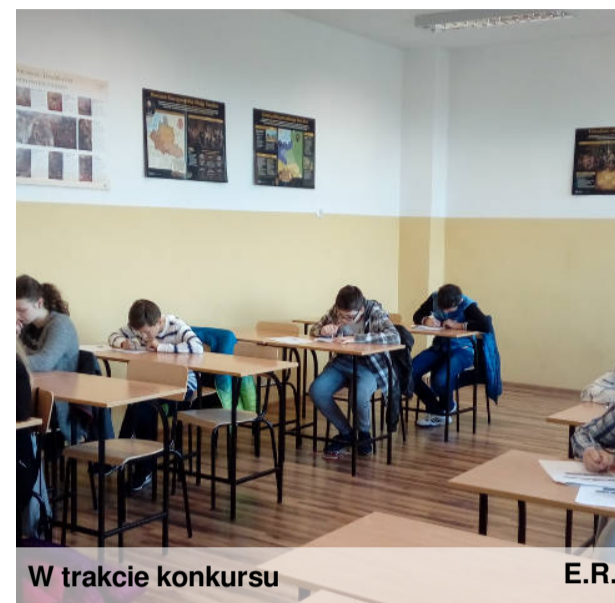
W trakcie konkursu