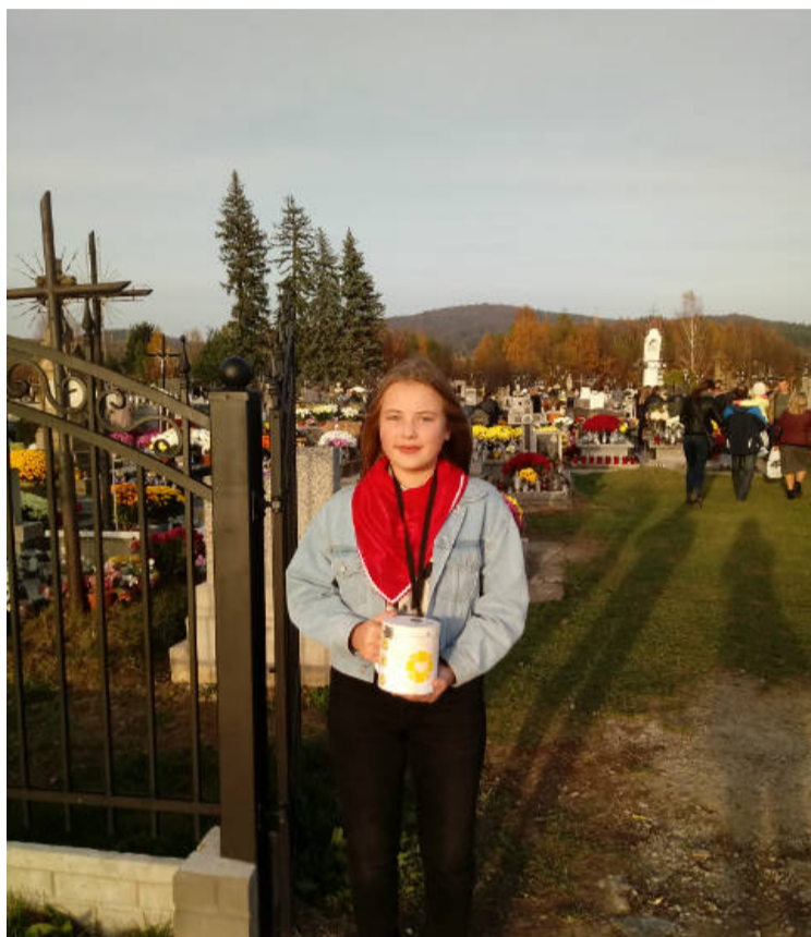
Kwesta na cmentarzu w Odrzykoniu