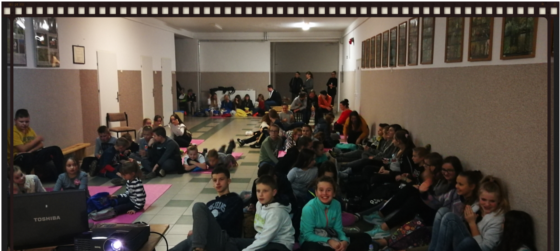
W trakcie seansu