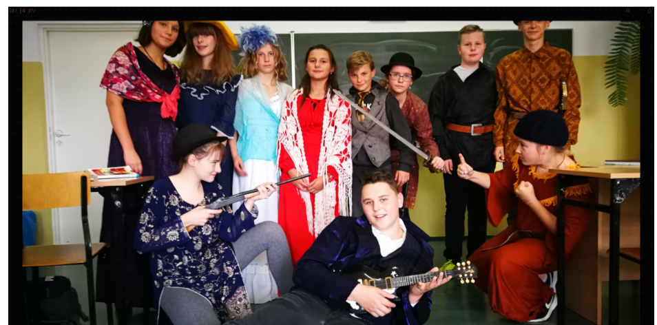
VIIA w akcji