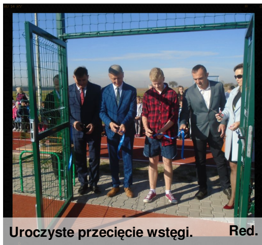
Uroczyste przecięcie wstęgi. Red.