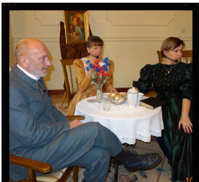
Widowisko historyczne o Marszałku.