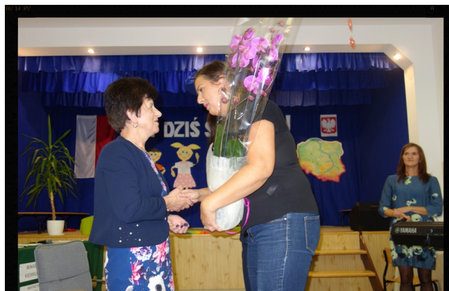
Podziękowanie od rodziców.