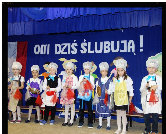
Zdrowo się odżywiają i jak grają! Red.