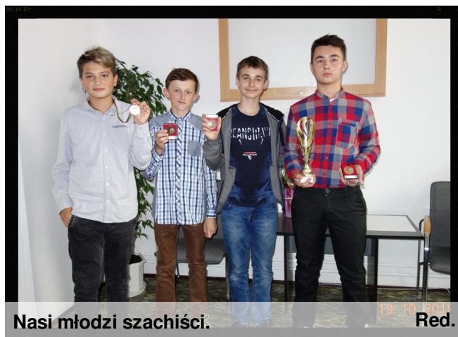
Nasi młodzi szachiści.