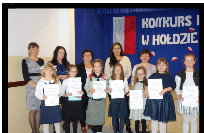
Laureaci konkursu recytatorskiego.

Laureaci (I, II i III miejsca) otrzymali nagrody książkowe ufundowane przez Radę Rodziców oraz dyplomy, a pozostałym recytatorom wręczono dyplomy uczestnictwa w konkursie.