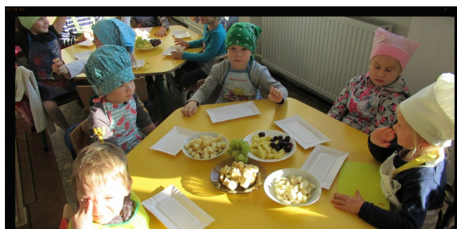
Maluchy i ich pyszne sałatki.