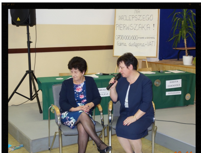
Nasza droga emerytka. Red.