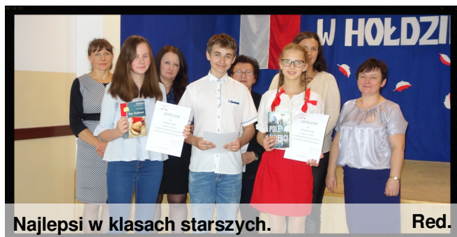
Najlepsi w klasach starszych.