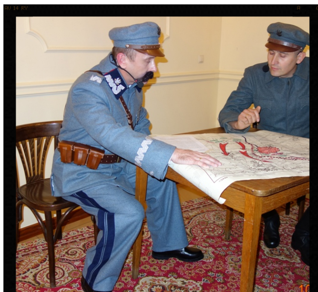
Cud nad Wisłą (1920).