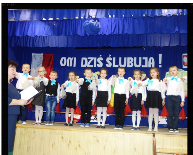
Uroczyste ślubowanie. Red.