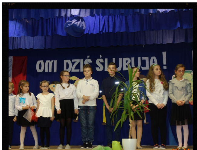
Słowa wdzięczności od uczniów. Red.