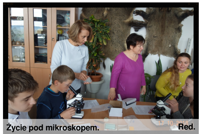
Życie pod mikroskopem.