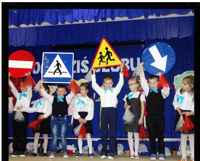
Pierwszaki znają znaki drogowe! Red.