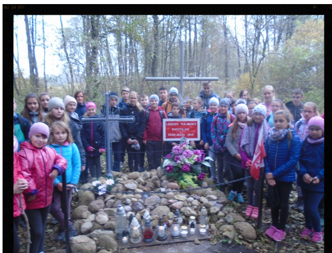
Nasz hołd dla bohaterów.