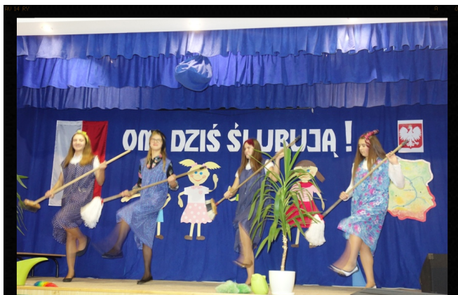
Taniec ze szczotkami.