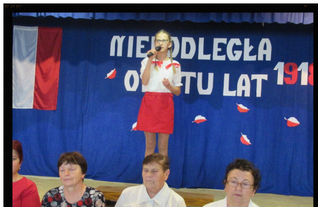
Wiersze o Ojczyźnie.