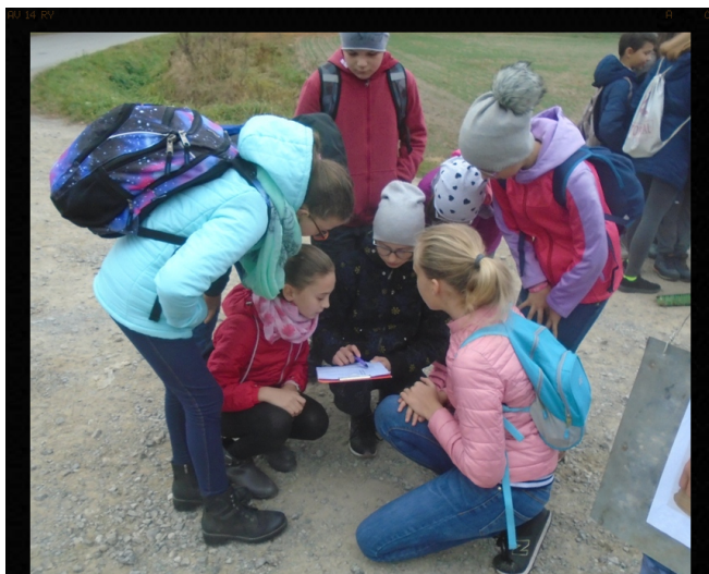
Na trasie - pierwsze zadanie.