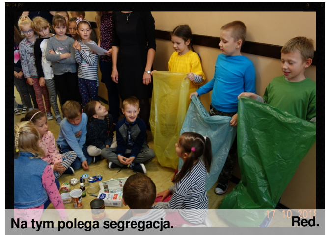
Na tym polega segregacja.