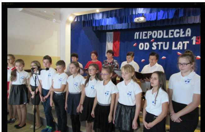
Koncert pieśni patriotycznych.