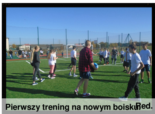
Pierwszy trening na nowym boisku Red.