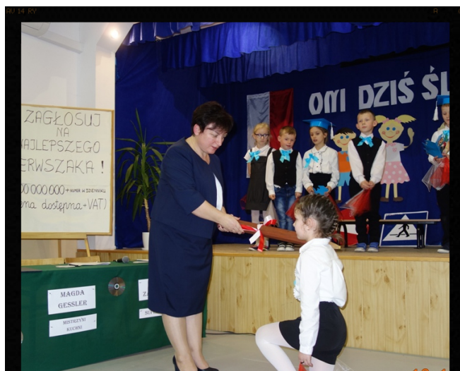
Pasowanie na uczniów. Red.