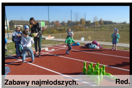
Zabawy najmłodszych. Red.