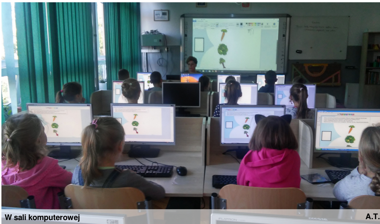
W sali komputerowej