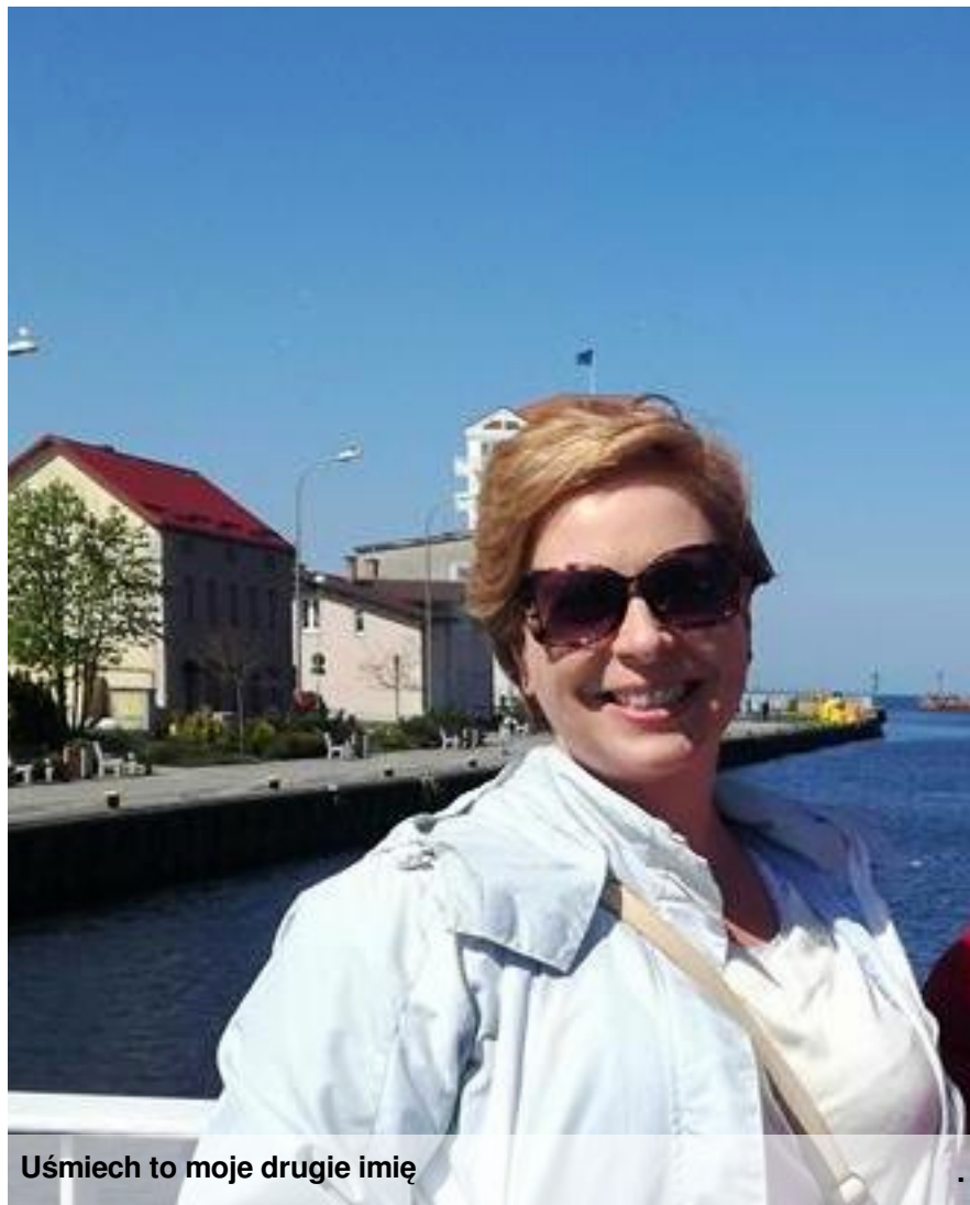
Uśmiech to moje drugie imię