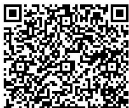
QR Derba Wiktoria