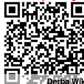
QR Derba Wiktoria

Pocałunki kojarzą nam się z lutym i walentynkami, ale to 28 listopada obchodzimy Dzień Pocałunków <3