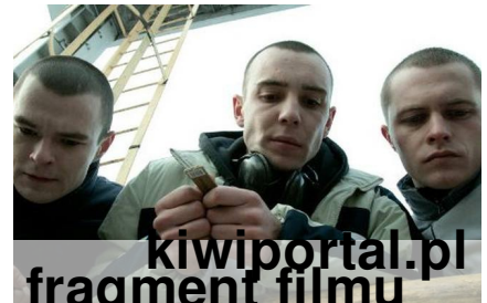
fragment filmu