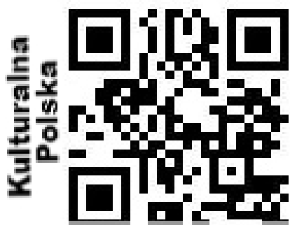
QR Derba Wiktoria

Kulturalna Polska, tu znajdziecie nie tylko sprawdzone i pomocne streszczenia lektur, ale powtórzycie epoki, otrzymacie pomoce przy interpretacji wiersza i poznacie wiele