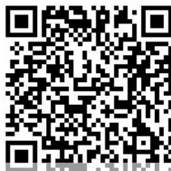
QR Derba Wiktoria