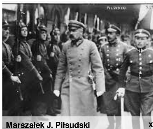
Marszałek J. Piłsudski