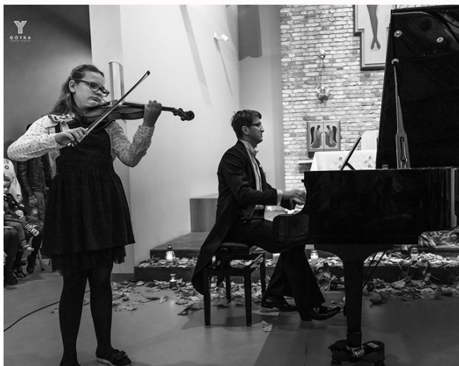
Dąbrowka Niepodległej GOYKA