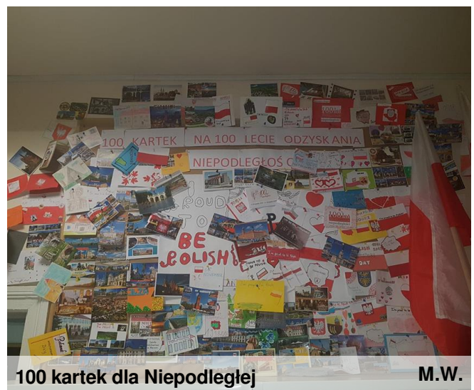
100 kartek dla Niepodległej