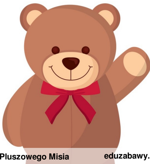
Dzień Pluszowego Misia