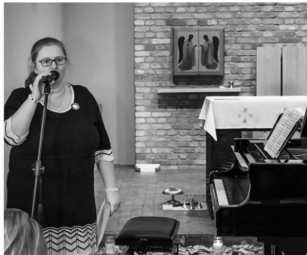
Dąbrowka Niepodległej GOYKA