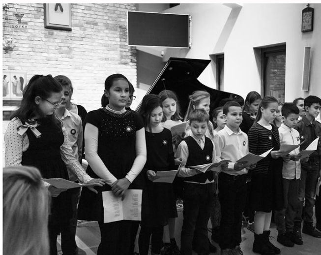
Dąbrowka Niepodległej GOYKA