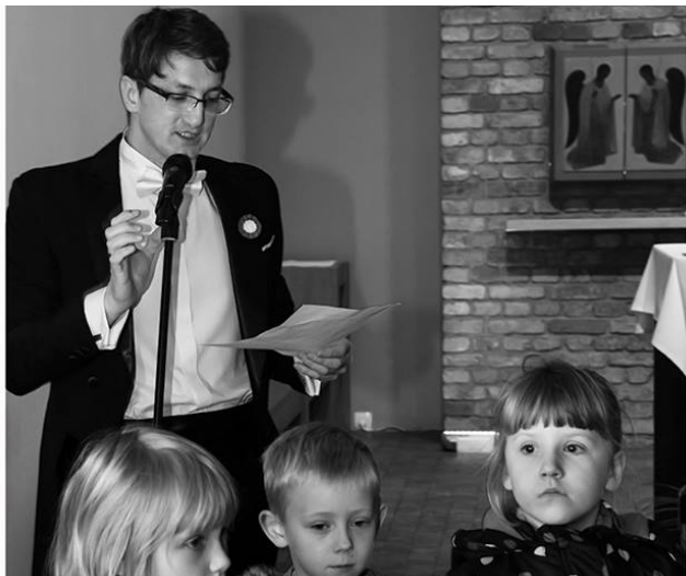
Dąbrowka Niepodległej GOYKA