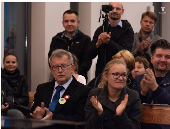
Dąbrowka Niepodległej GOYKA