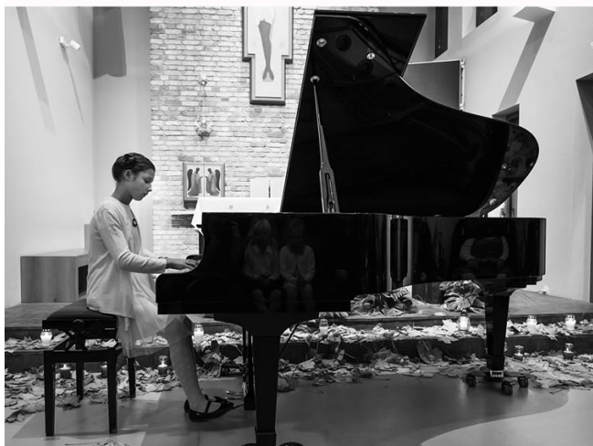
Dąbrowka Niepodległej GOYKA