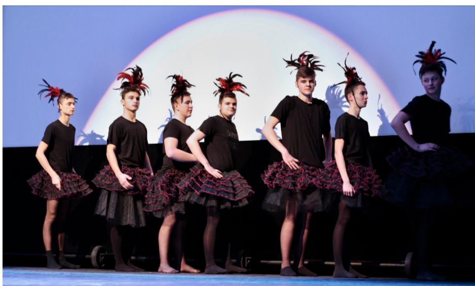
Balet rosyjski -III kl.