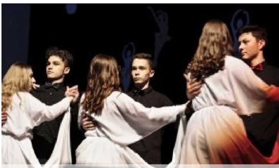
Walc wiedeński - kl. VIII