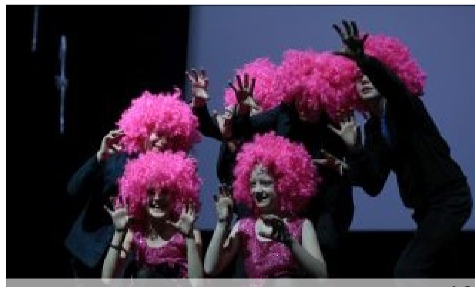
Różowa Pantera - klasy V