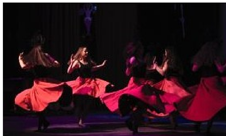
Prosto z Paryża - kl.III