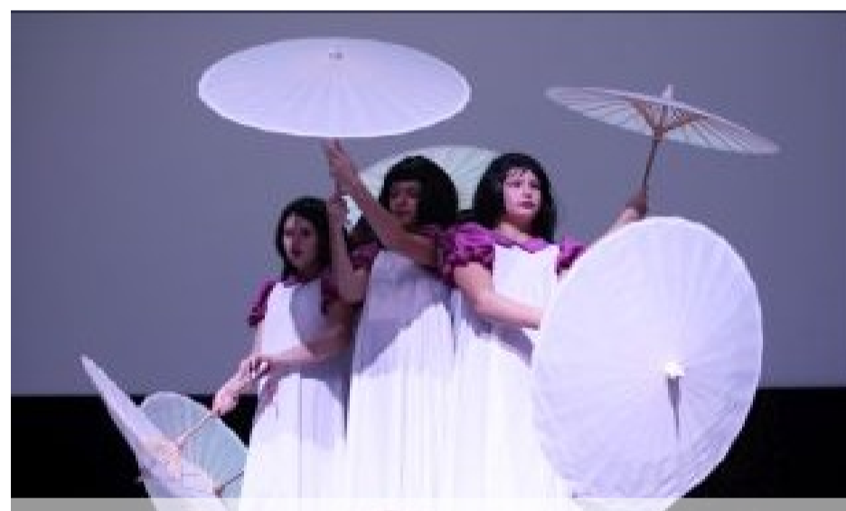
Prosto z Japonii - kl.V