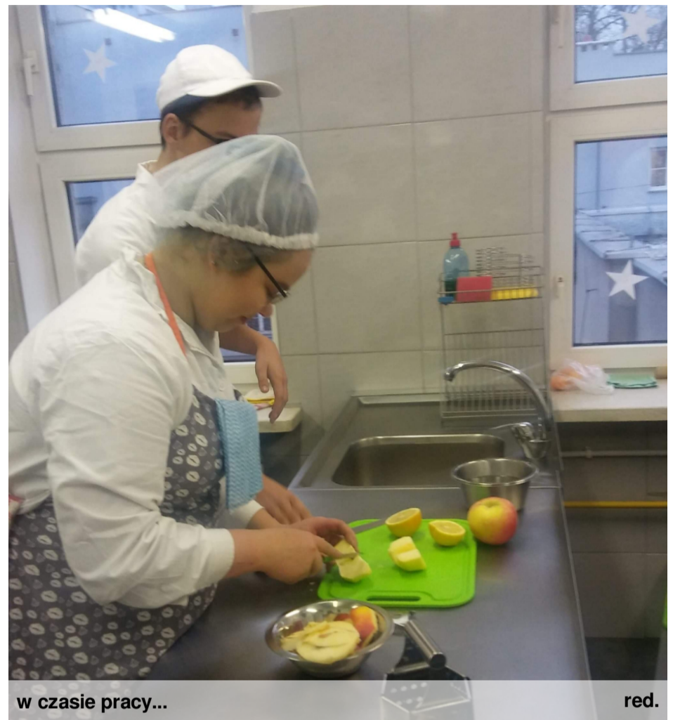
w czasie pracy...