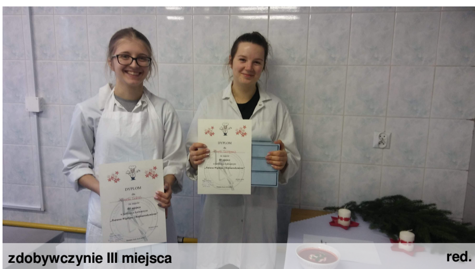
zdobywczynie III miejsca