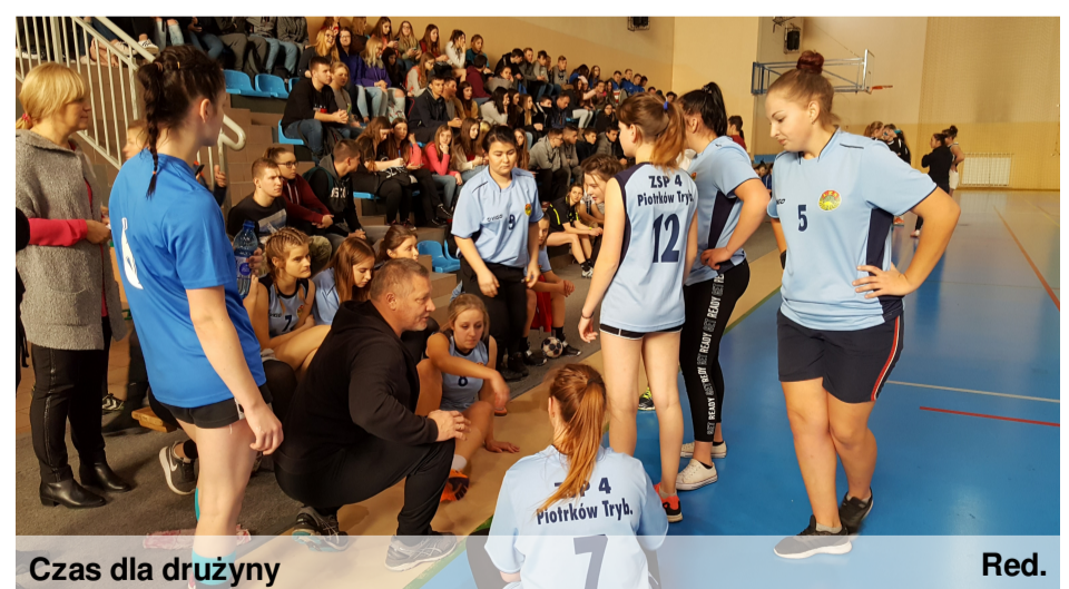
Czas dla drużyny