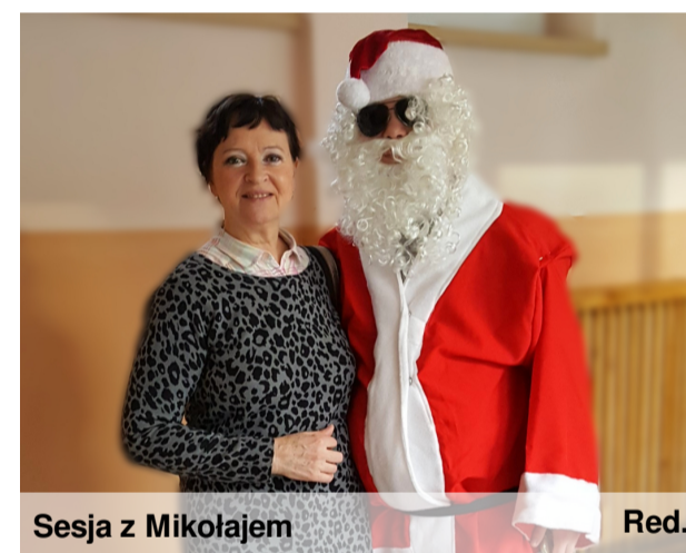
Sesja z Mikołajem