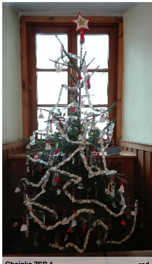
Choinka ZSP 4