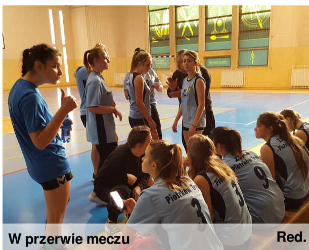
W przerwie meczu

29 listopada odbył się finał Mistrzostw w Piłce Ręcznej Dziewcząt, w których wzięło udział 6 szkół ponadgimnazjalnych z województwa łódzkiego. Wśród nich znalazły się nasze mistrzyni Piotrkowa Trybunalskiego. W pierwszym meczu szczypiornistki z ZSP 4 gładko pokonały 13:1 dziewczyny z Pabianic. W następnych spotkaniach starły się z drużynami z Wielunia i Tomaszowa Mazowieckiego. Te trzy spotkania były bardzo wyczerpujące - nadweryżyły siły naszych piłkarek, które już bardzo zmęczone nie dały rady wygrać w finale z łodziankami. Ostatecznie jednak drużyna zdobyła drugie miejsce i tytuł wicemistrzyń województwa łódzkiego.