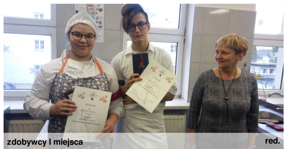
zdobywcy I miejsca