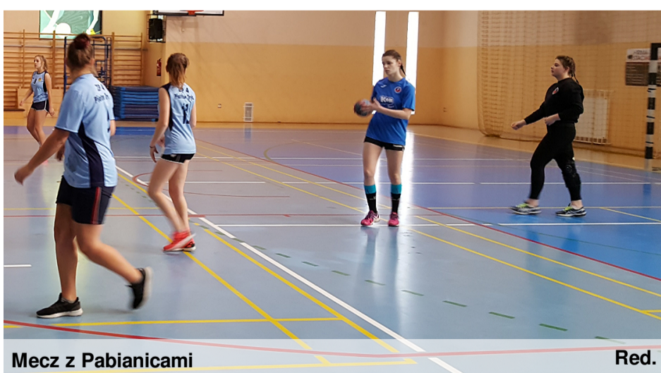
Mecz z Pabianicami