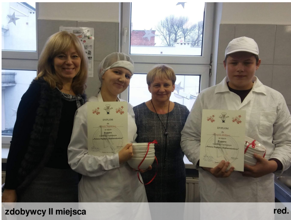
zdobywcy II miejsca