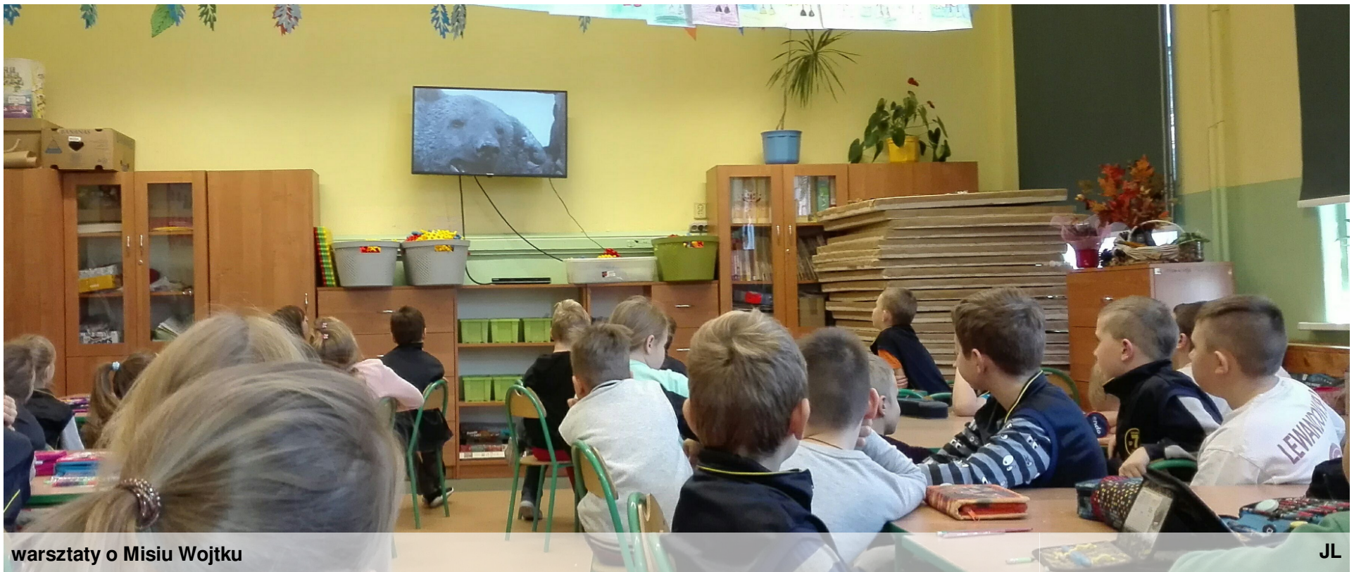
warsztaty o Misiu Wojtku