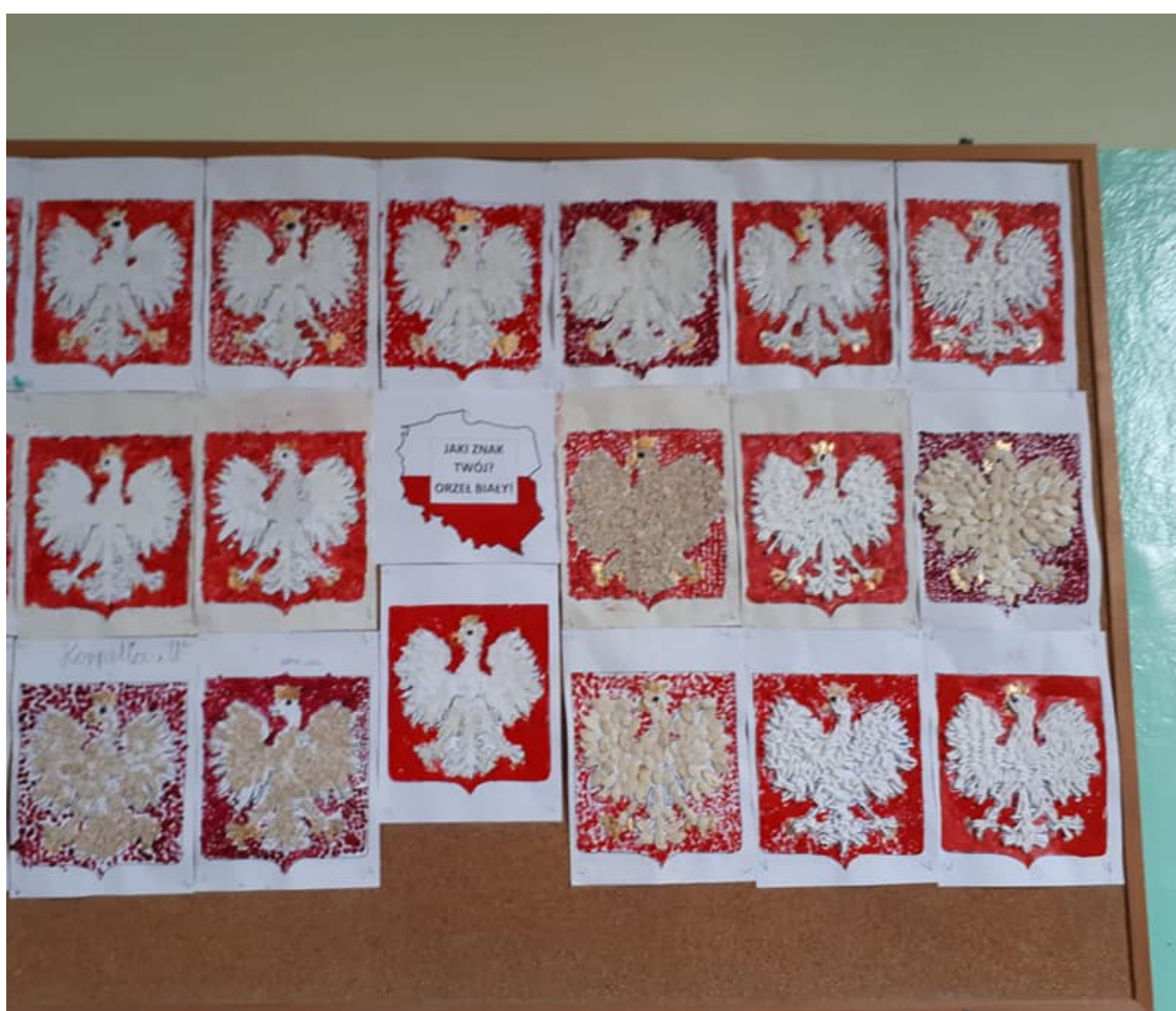
Prace uczniów świetlicy

O godzinie 11.11 w naszej szkole odśpiewano hymn państwowy. W akademii wzięli udział wszyscy uczniowie oraz nauczyciele naszej szkoły.