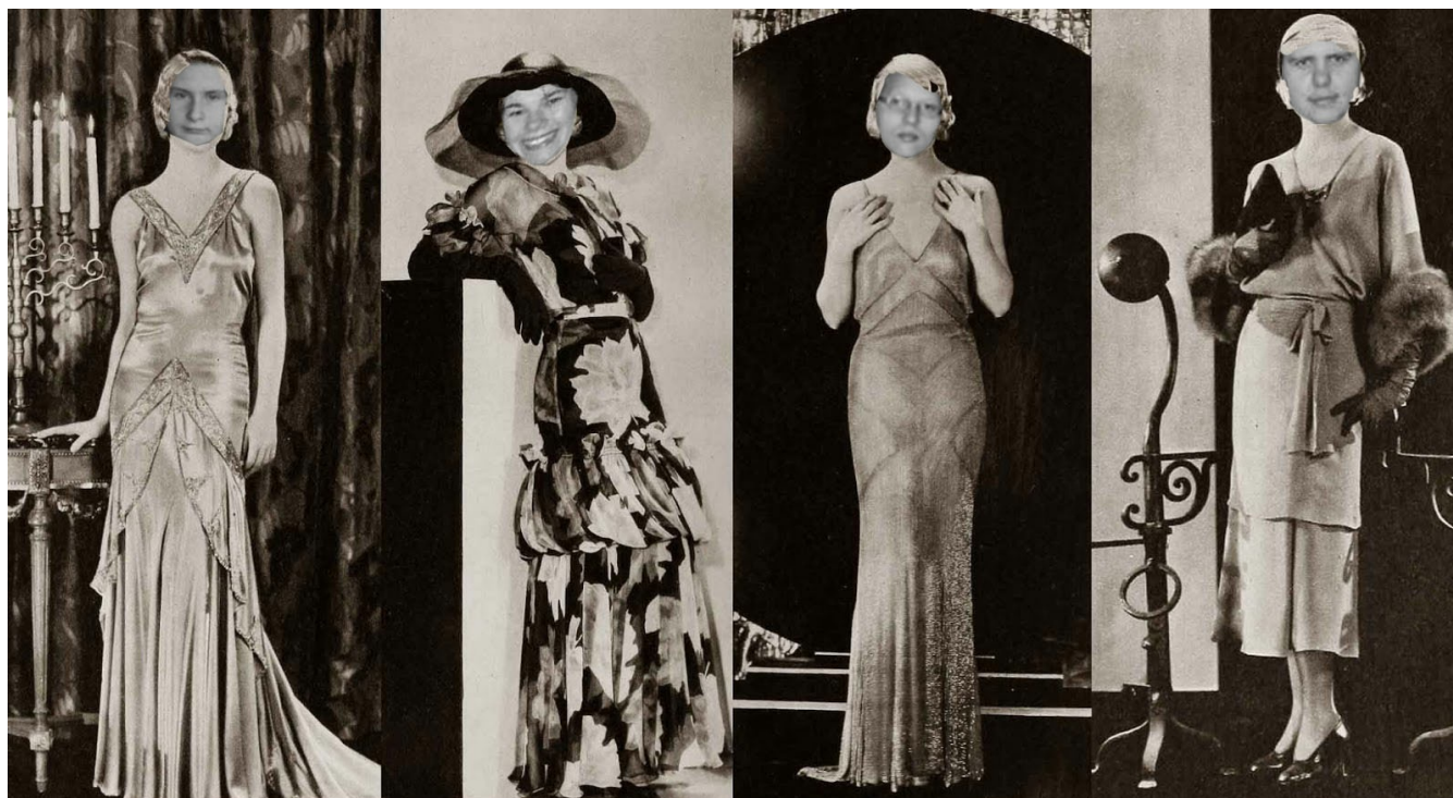
Carole lombard models four summer dresses - June 1930

Moda lat 30. znacznie różniła się od tej promowanej w poprzednim dziesięcioleciu. Najważniejsza różnica polegała na skromności ubioru, a wynikała ona ze zmian w panującej sytuacji gospodarczej. W 1929 roku miał miejsce największy kryzys XX wieku, który według historyków objął wszystkie kraje i wszystkie dziedziny życia, w tym modę. Prawdziwą rewolucją w ówczesnym ubiorze były...materiały! Kryzys zmusił producentów do oszczędności, a więc wielu z nich zrezygnowało z prestiżowych, naturalnych tkanin na rzecz sztucznych odpowiedników. Po raz pierwszy na rynku pojawił się nylon, a więc i rajstopy, które stały się prawdziwym hitem dekady.