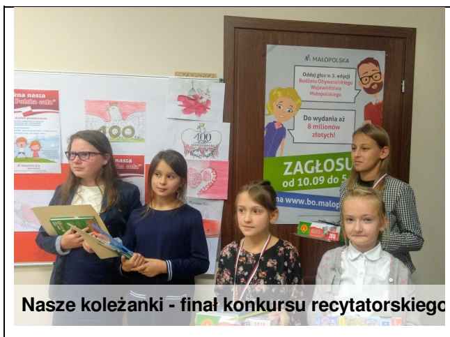
Nasze koleżanki - finał konkursu recytatorskiego

Podsumowanie konkursu recytatorskiego "A ja jestem Polak mały" zorganizowanego przez Stowarzyszenie LGD "Przyjazna Ziemia Limanowska" już za nami. Konkurs miał na celu rozwijanie zdolności recytatorskich dzieci, popularyzację utworów literackich o tematyce patriotycznej oraz budowanie postaw patriotycznych młodego pokolenia.