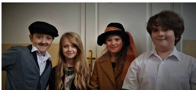
Artyści z koła teatralnego