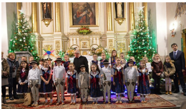
Kl. IIb (z tyłu z gwiazdą)