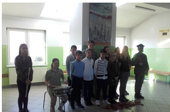
I miejsce - klasa VIb

II miejsce klasa 7b, III miejsce klasa 7a.