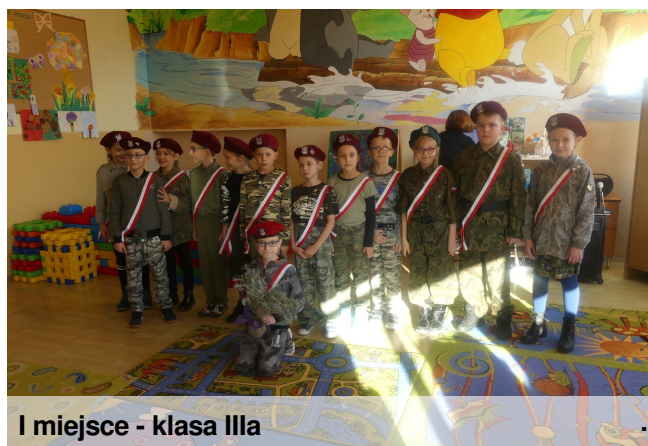
I miejsce - klasa IIIa