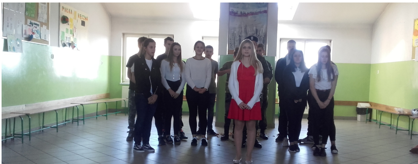
I miejsce - klasa IIIc