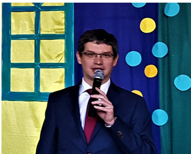
Przemówienie Pana Wójta