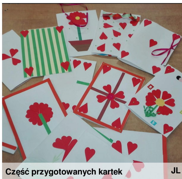
Część przygotowanych kartek

Zawsze mnie wspierają i otaczają opieką. Za to, że są mili. (6 odpowiedzi) Za dobre obiady i miłość. Za wszystko! (6 odpowiedzi) Za opiekę!