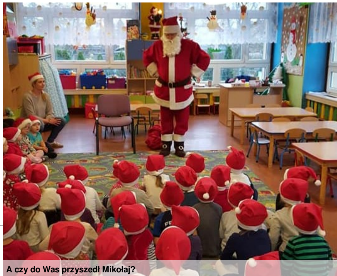
A czy do Was przyszedł Mikołaj?