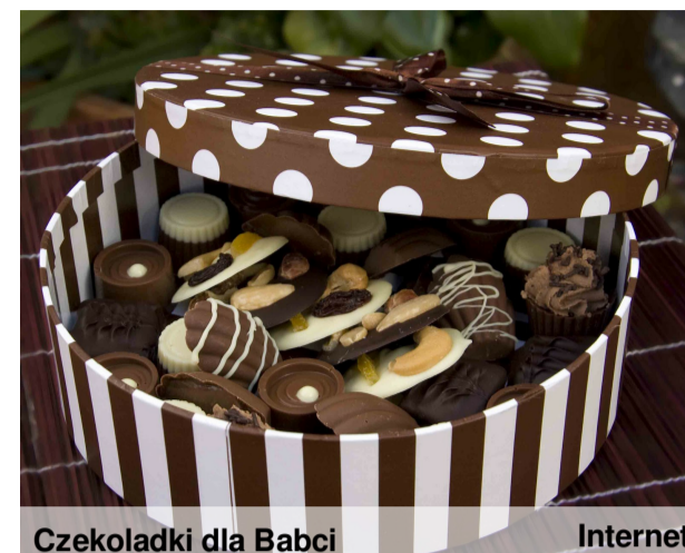
Czekoladki dla Babci