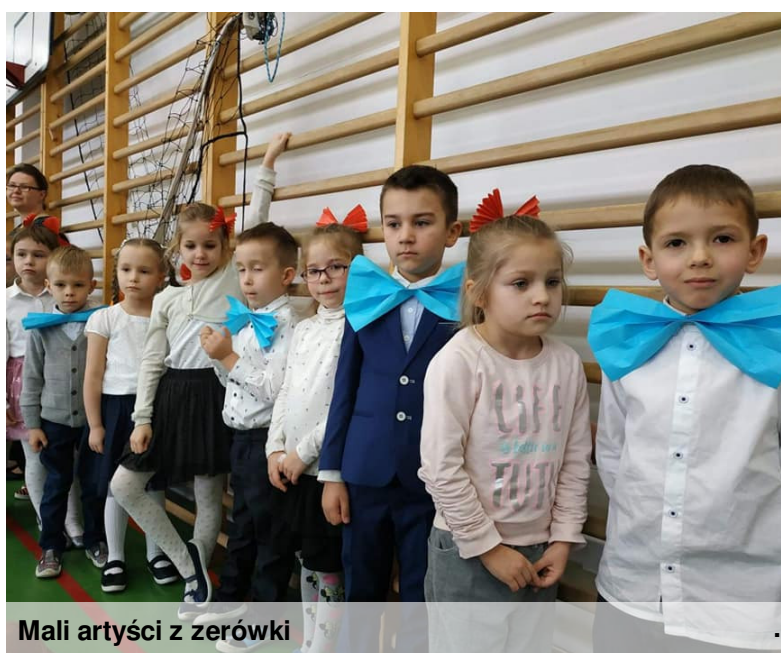
Mali artyści z zerówki