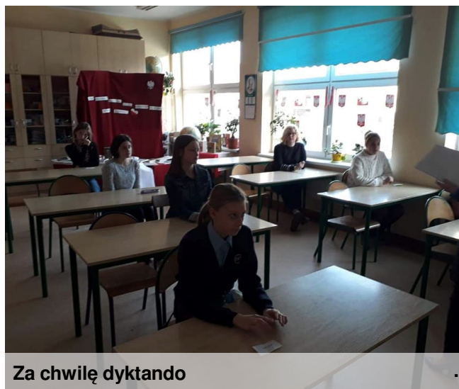
Za chwilę dyktando