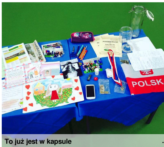
To już jest w kapsule