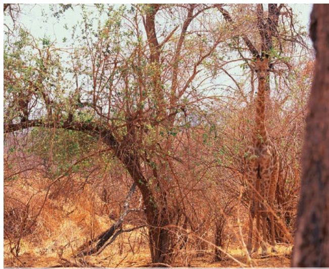
ZAGADKA NR 2