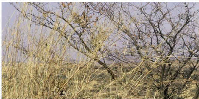
ZAGADKA NR 1