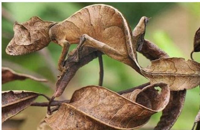
ZAGADKA NR 3