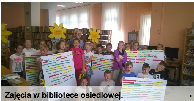
Zajęcia w bibliotece osiedlowej.

Nasi uczniowie aktywnie zdobywają wiedzę: uczestniczą w warsztatach na Uniwersytecie Rzeszowskim, dokonują pomiarów w szkolnej stacji meteorologicznej, korzystają z nowoczesnych pomocy dydaktycznych, uczestniczą w spotkaniach z cenionymi i poważanymi osobami.