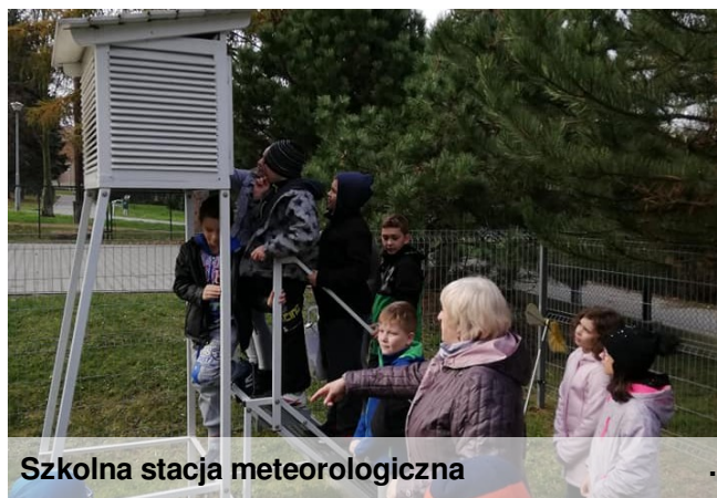
Szkolna stacja meteorologiczna