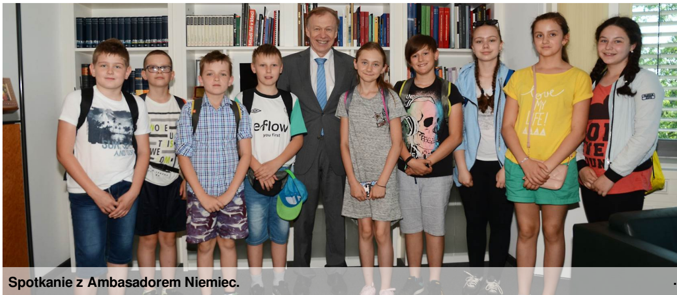
Spotkanie z Ambasadorem Niemiec.

Nasi uczniowie rozwijają pasje dziennikarskie. Od 10 lat redagują gazetkę szkolną "PiSAK". Natomiast od ponad roku wydajemy ją również w wersji elektronicznej. Już drugi rok uczestniczymy w ogólnopolskim projekcie Junior Media.