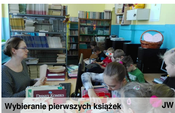
Wybieranie pierwszych książek