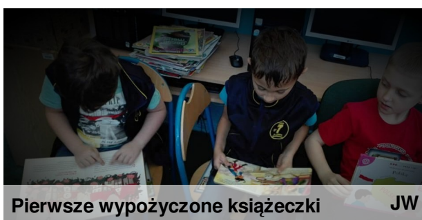
Pierwsze wypożyczone książeczki