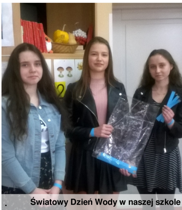
Światowy Dzień Wody w naszej szkole