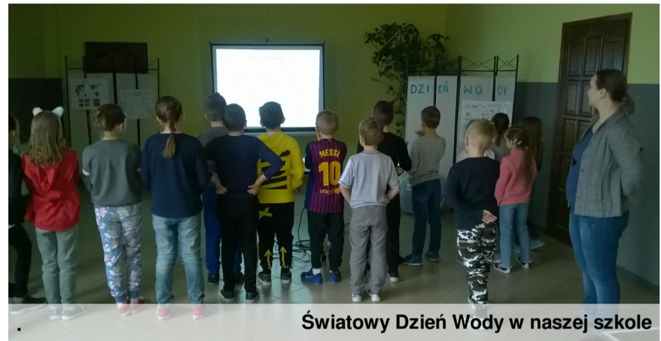
Światowy Dzień Wody w naszej szkole