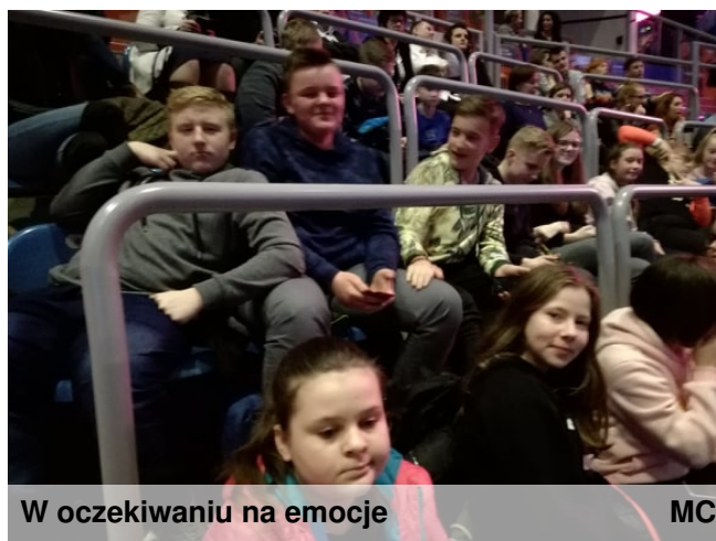
W oczekiwaniu na emocje