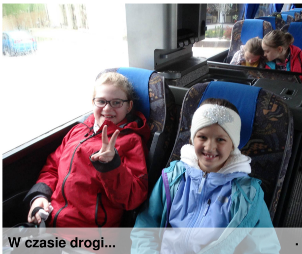
W czasie drogi...