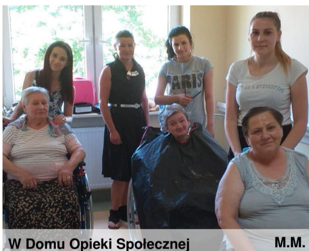
W Domu Opieki Społecznej