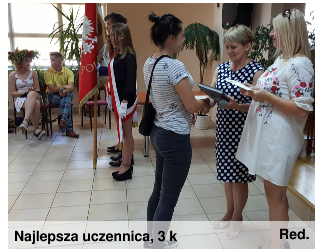
Najlepsza uczennica, 3 k