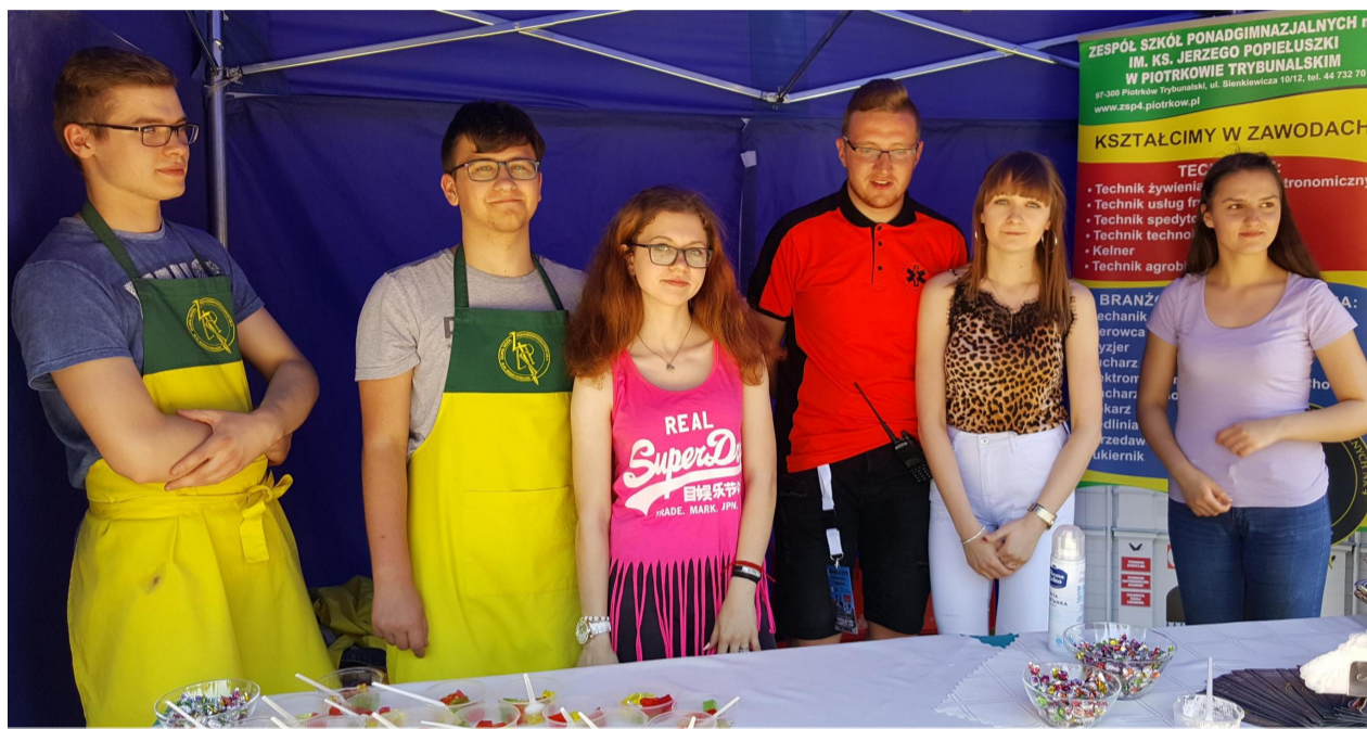
Stoisko ZSP 4

Bezchmurne niebo i sielankowa atmosfera imprezy tworzyły wakacyjny klimat.