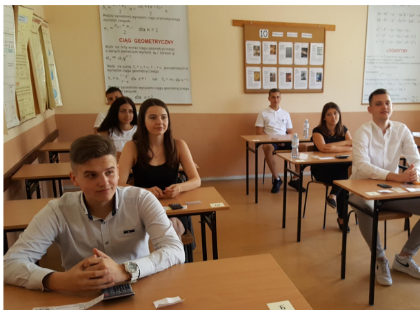
Egzamin 18 czerwca