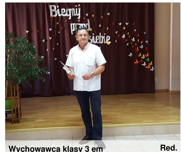
Wychowawca klasy 3 em