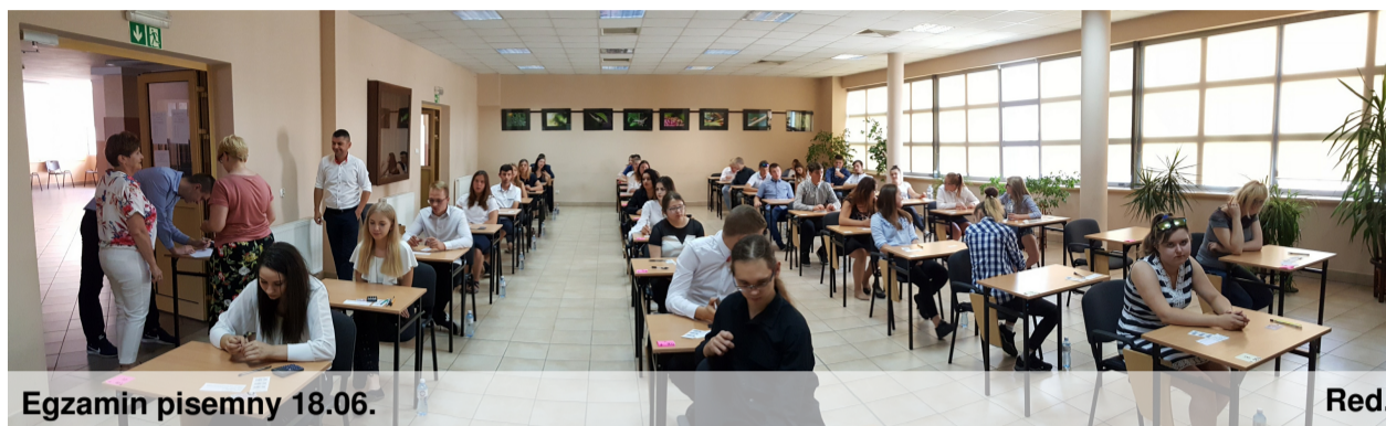
Egzamin pisemny 18.06.

T.06. - sporządzanie potraw i napojów, A.19. - wykonywanie zabiegów fryzjerskich, A.23. - organizowanie i nadzorowanie transportu. Część pisemna polegała na rozwiązaniu pytań testowych w ciągu 60 minut. Kolejny etap to