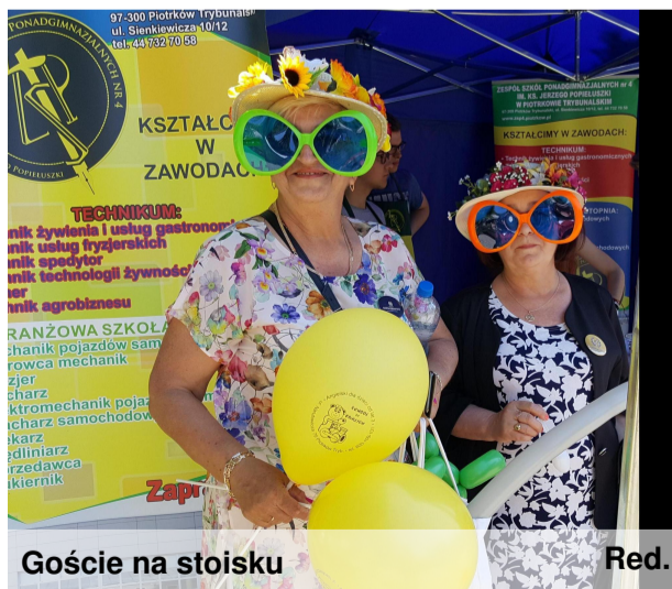
Goście na stoisku