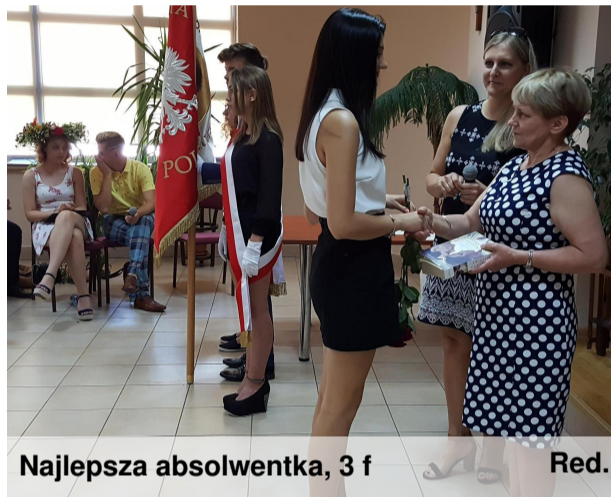
Najlepsza absolwentka, 3 f