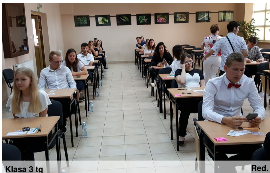
Klasa 3 tg