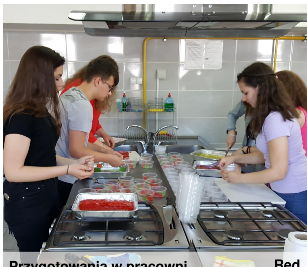
Przygotowania w pracowni