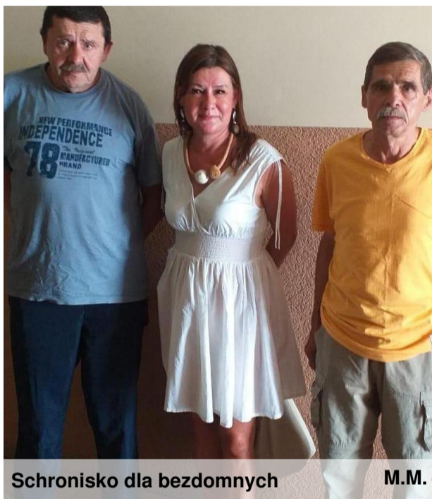
Schronisko dla bezdomnych