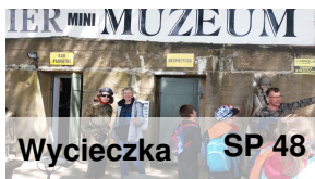
Wycieczka SP 48

Maj jest miesiącem, w którym w naszej szkole przede wszystkim pamięta się o bezpieczeństwie. Wynika to z tego, że niebawem będą wakacje i wszyscy chcielibyśmy szczęśliwie i zdrowo z nich powrócić.