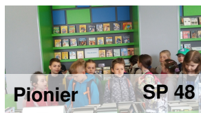
Pionier SP 48