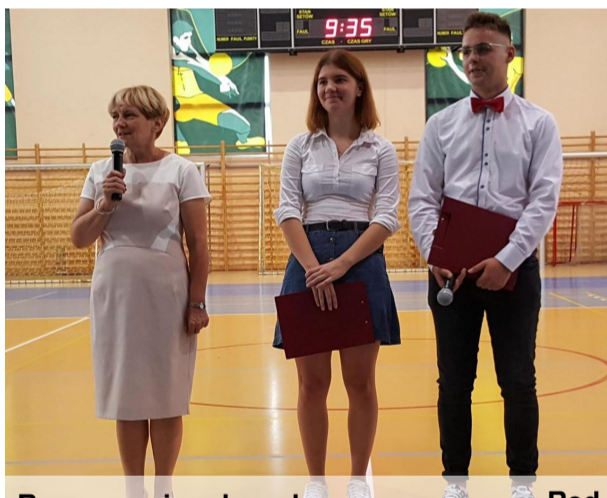
Rozpoczęcie roku szk.