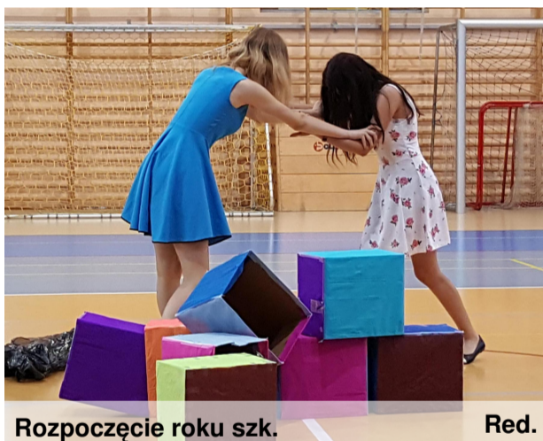
Rozpoczęcie roku szk.