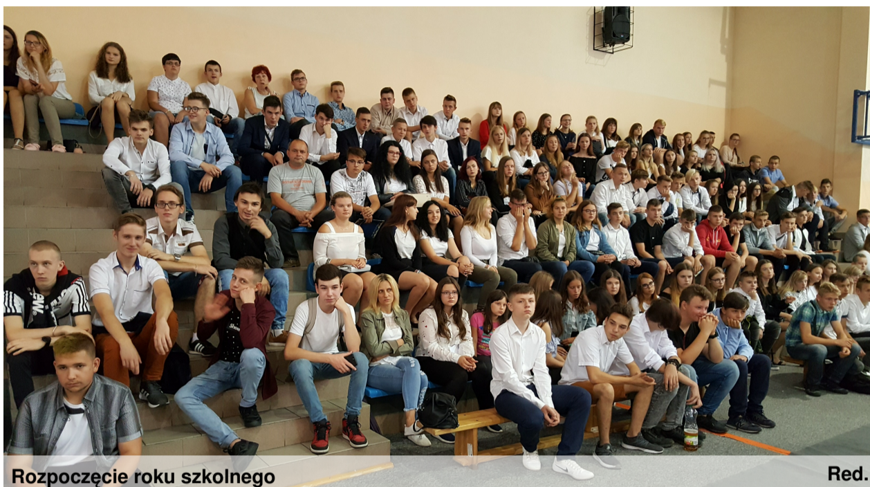
Rozpoczęcie roku szkolnego