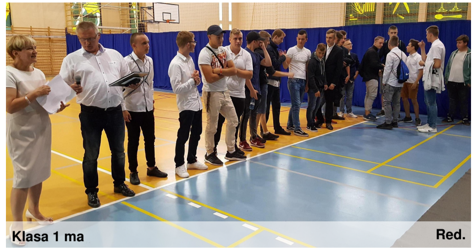
Klasa 1 ma