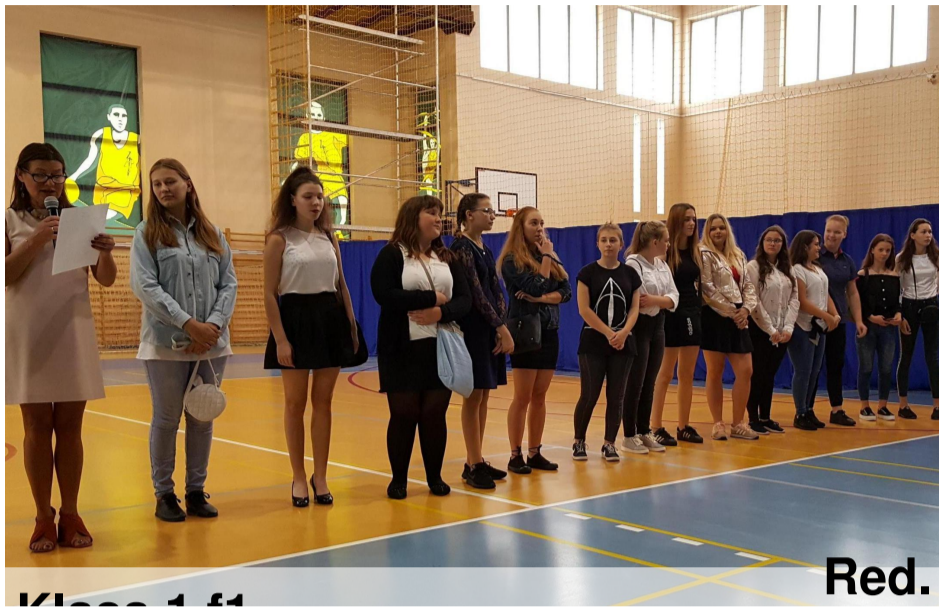
Klasa 1 f1