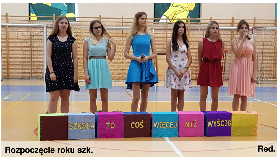
Rozpoczęcie roku szk.