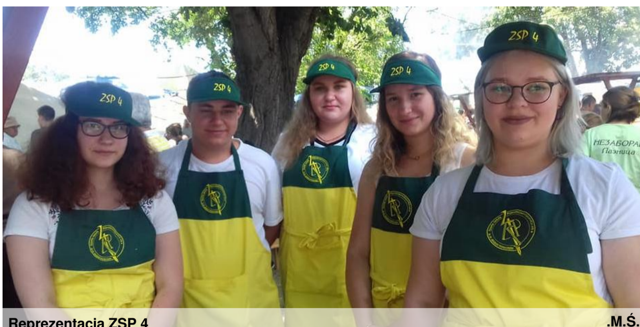
Reprezentacja ZSP 4