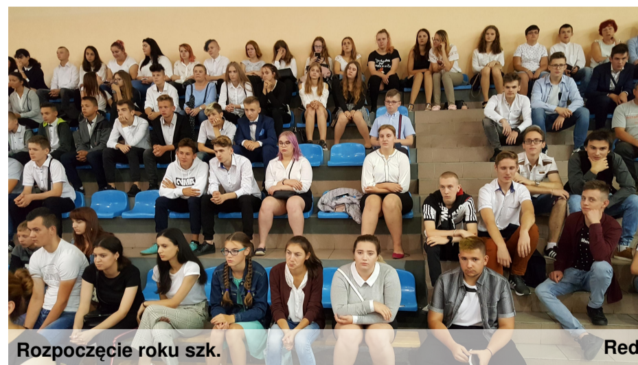
Rozpoczęcie roku szk.