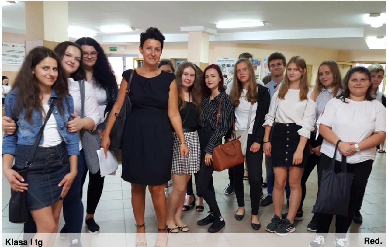
Klasa I tg

Drugi września oficjalnie został ogłoszony dniem rozpoczęcia roku szkolnego 2019/2020 i żadną ustawą nie da się tego odwołać. Zamiast więc utyskiwać i ronić łzy, zacznijcie korzystać z czasu spędzonego w szkole. Wkoło was jest mnóstwo ciekawych, fajnych ludzi. Gdzieś w tym tłumie - na razie anonimowym - są być może wasi najlepsi przyjaciele. Z pewnością też magnetyzm serc sprawi, że odnajdą się przeznaczone sobie dusze. Zaczynajcie więc od pierwszych dni intensywnie zawierać nowe