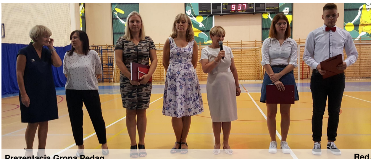
Prezentacja Grona Pedag.