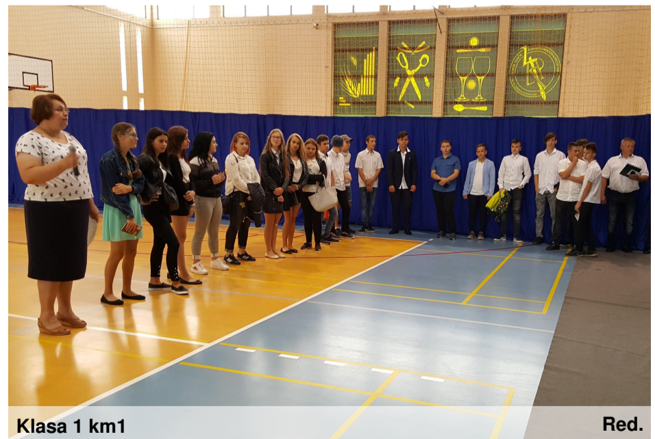
Klasa 1 km1