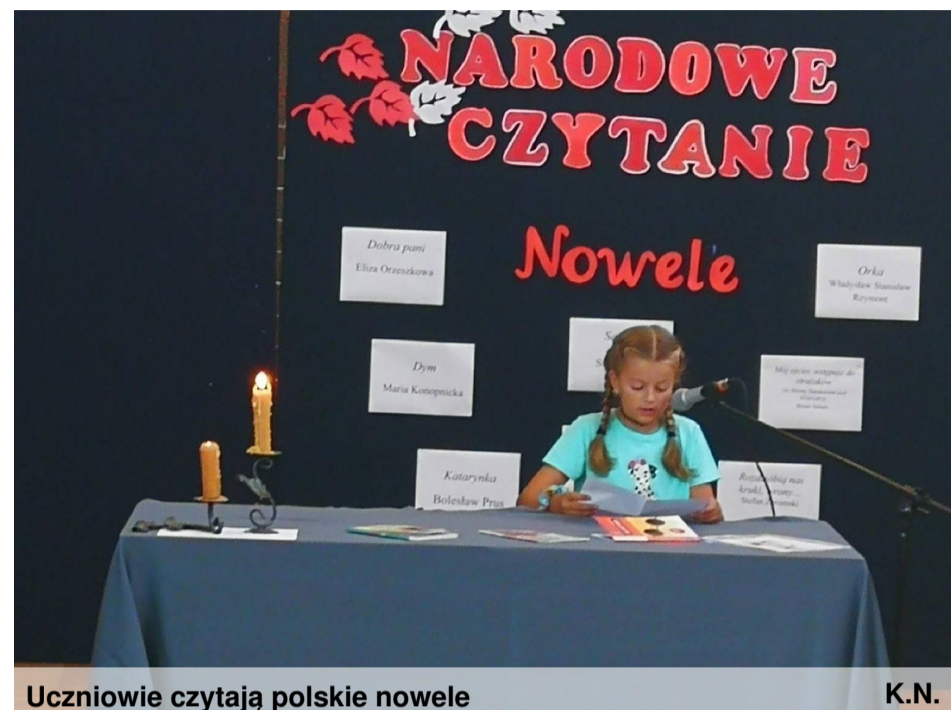
Uczniowie czytają polskie nowele