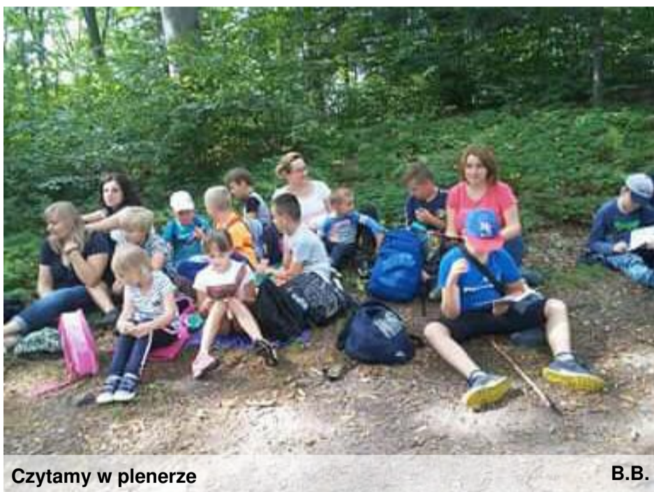
Czytamy w plenerze