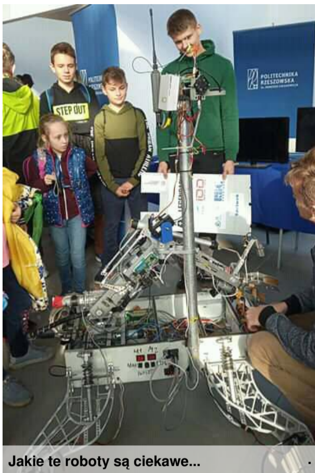
Jakie te roboty są ciekawe...