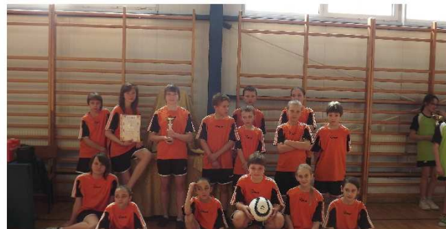
fot: drużyna szkolna na gminnym turnieju sportowym.