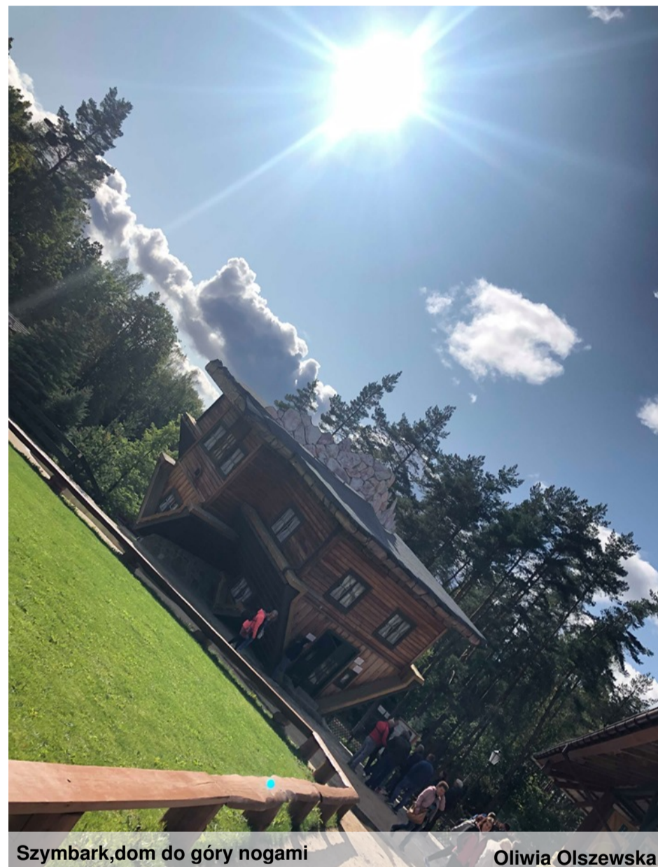
Symbark, dom do góry nogami