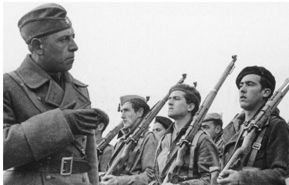
Legion Condor – niemiecka jednostka wojskowa wspierająca siły gen. Francisco Franco podczas hiszpańskiej wojny domowej. Na zdjęciu powyżej żołnierze tej jednostki.

31 sierpnia 1939 r. o godz. 12.40 Hitler wydał ostateczny (poufny) rozkaz zaatakowania Polski następnego dnia. Tego samego dnia miało miejsce początek działań dywersyjnych w ramach operacji „Himmler” mających na celu obarczeniu winą Polski za wybuch wojny. Najbardziej znanym incydentem podczas operacji „Himmler” przed wybuchem wojny była prowokacja gliwicka, natomiast w czasie wojny – krwawa niedziela (niem. Bromberger Blutsonntag), do której doszło 3 września w Bydgoszczy.