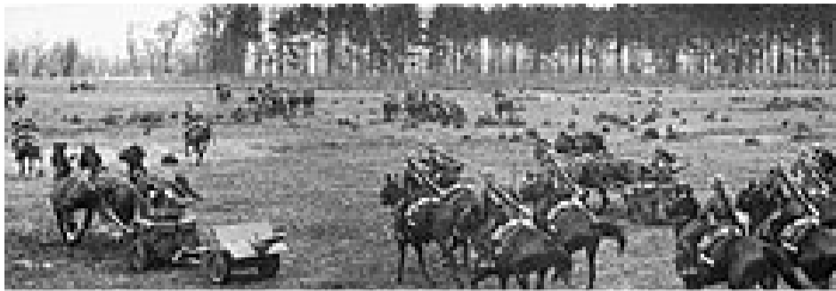
Wielkopolska Brygada Kawalerii w bitwie nad Bzurą