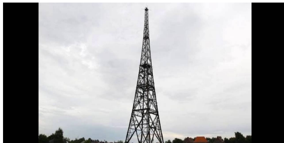
Radiostacja w Gliwicach.