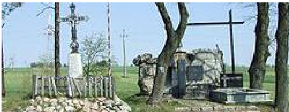
Miejsce pamięci o bitwie i pozostałości schronu na Strękowej Górze