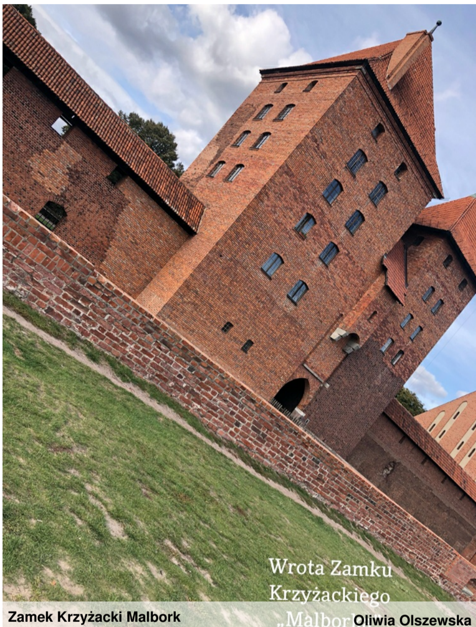
Zamek Krzyżacki Malbork