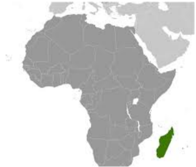
Położenie wyspy względem Afryki.

Na wyspie żyją lemury, jeże, nietoperze, różnorodne ptaki oraz wiele kameleonów i węży. Ok. 88 mln lat temu Madagaskar oddzielił się od subkontynentu indyjskiego, co pozwoliło rodzimej faunie i florze ewoluować we względnej izolacji. Dlatego Madagaskar ma bardzo bogaty ekosystem, ponad 90 % małej dzikiej przyrody nie występuje w żadnym innym miejscu na Ziemi.