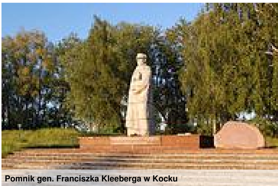
Pomnik gen. Franciszka Kleeberga w Kocku