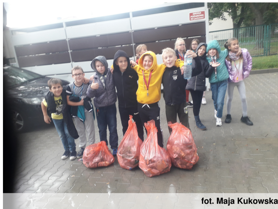
fot. Maja Kukowska