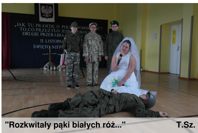
"Rozkwitały pąki białych róż..."