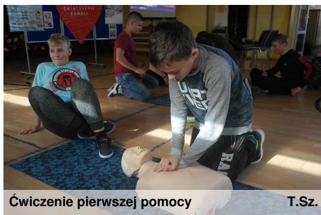
Ćwiczenie pierwszej pomocy