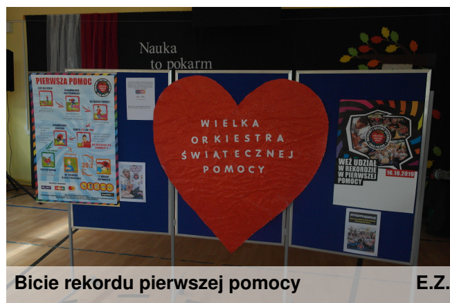
Bicie rekordu pierwszej pomocy