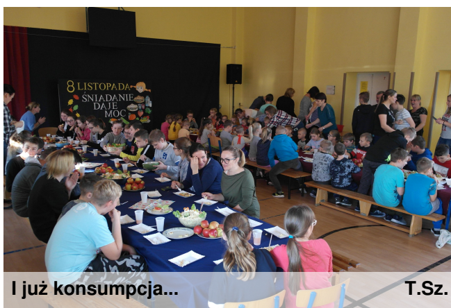
I już konsumpcja...