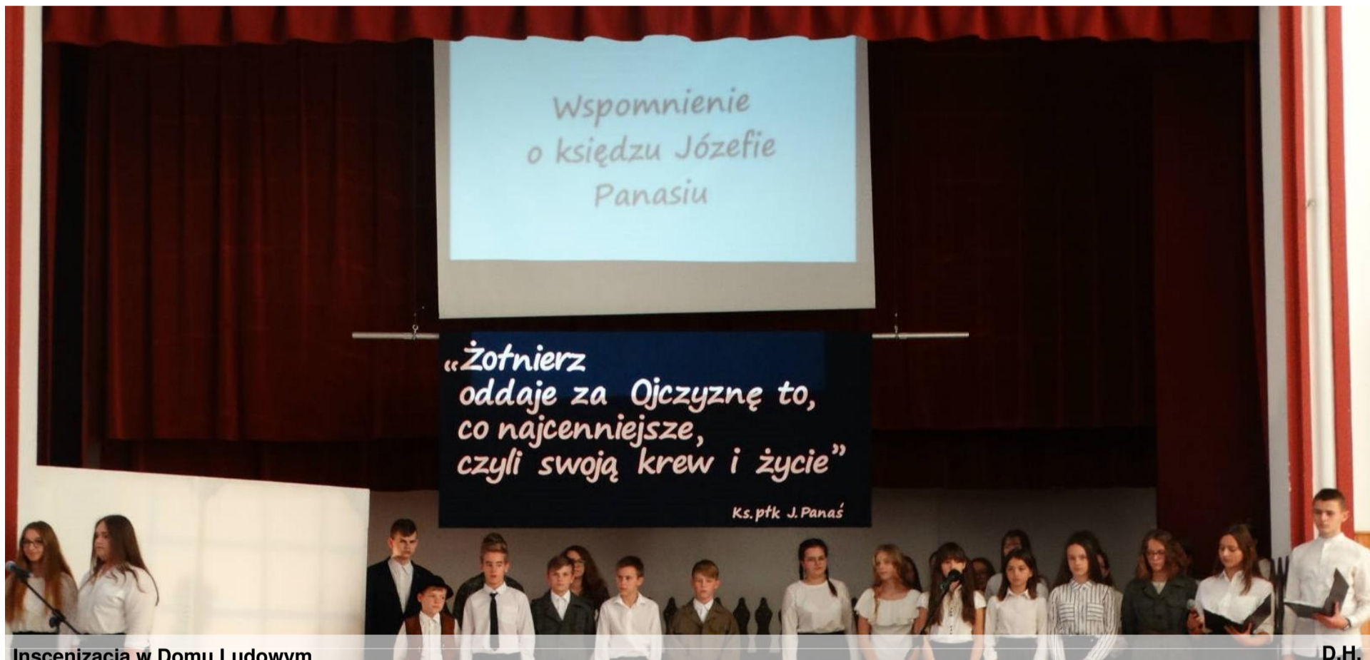
Inscenizacja w Domu Ludowym