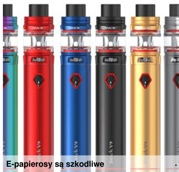
E-papierosy są szkodliwe