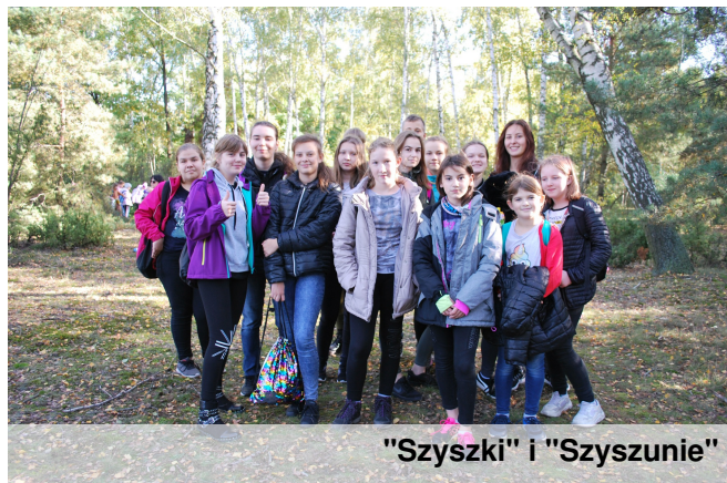
"Szyszki" i "Szyszunie"