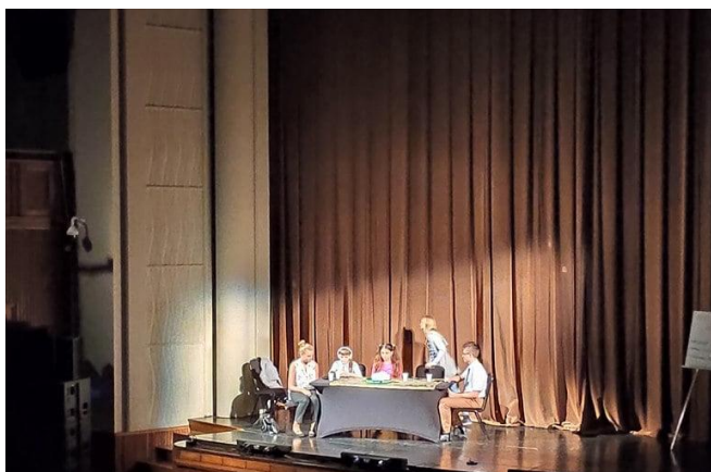
Pałac Młodzieży Katowice