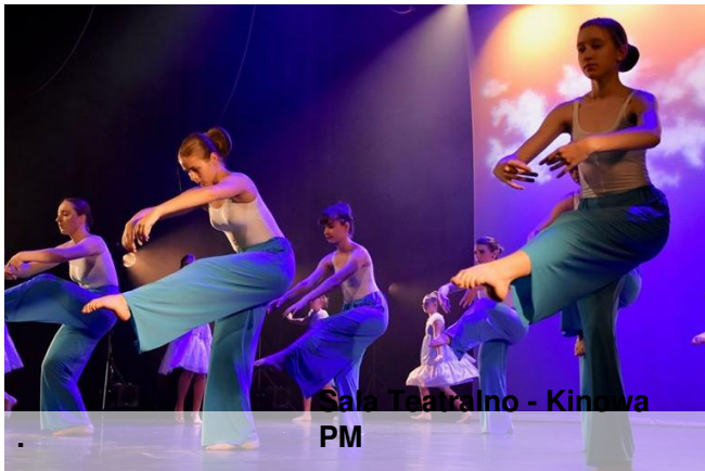
Sala Teatralno - Kinowa PM

Oglądanie tańca może być cudownym przeżyciem. Oglądanie tańca wykonanego przez tancerzy z wielką wyobraźnią i pasją może sprawiać jeszcze więcej radości. 20 września w Pałacu Młodzieży uczniowie klasy 7a mieli okazję obejrzeć spektakl taneczny "Introwersje". Przedstawienie w wykonaniu Studia Tańca Współczesnego i Baletu "ARABESKA" oraz zespołu Słoneczni jest wzruszającą, przejmującą i niezwykle pouczającą historią poruszającą temat zmysłów oraz najczęstszych zachowań przy spektrum autyzmu. Ten trudny temat zaprezentowany jest na scenie oczyma wyobraźni około 150 wspaniałych młodych tancerzy.