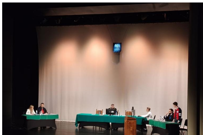
Pałac Młodzieży Katowice

Zaczyna się zupełnie niewinnie. Wiadomości tekstowe, telefony, zaczepianie na szkolnym korytarzu. Ktoś może powiedzieć: „I co z tego, że do Ciebie pisze? Lubi Cię po prostu.” Tak, do pewnego momentu może to być objaw sympatii. Tylko tyle. Jeśli jednak wiadomości stają się coraz częstsze i przestają nas cieszyć lub gdy nadawcy