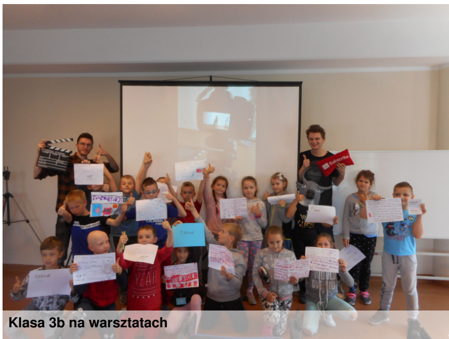
Klasa 3b na warsztatach